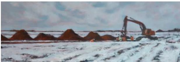
winterlandscape, 2021 oil on wood, 21 x 61 cm