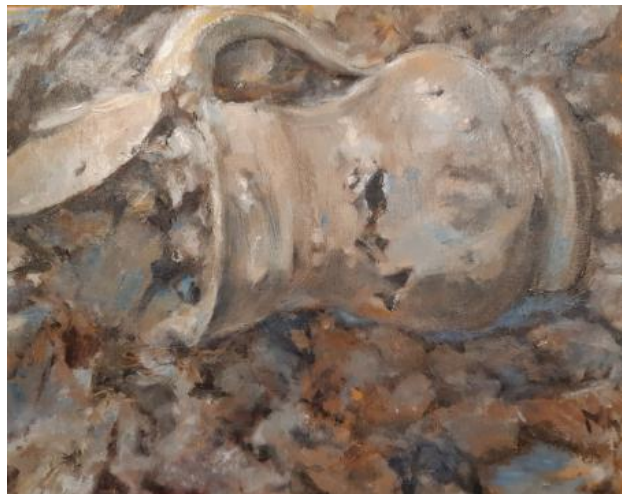
The jug, 2021 olieverf op doek, 24 x 30 cm.