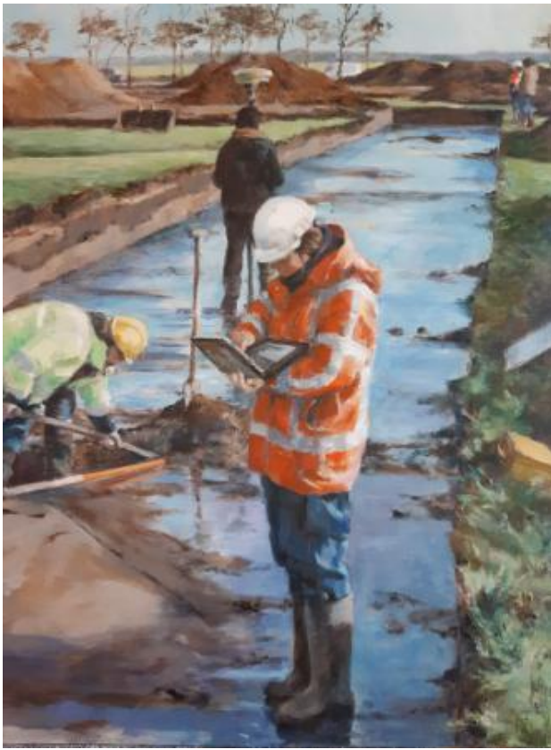
The WP4, 2021 olieverf op board, 47 x 62 cm