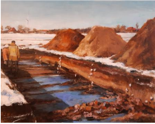
excavation of a canal, 2021 oil on canvas, 40 x 50 cm