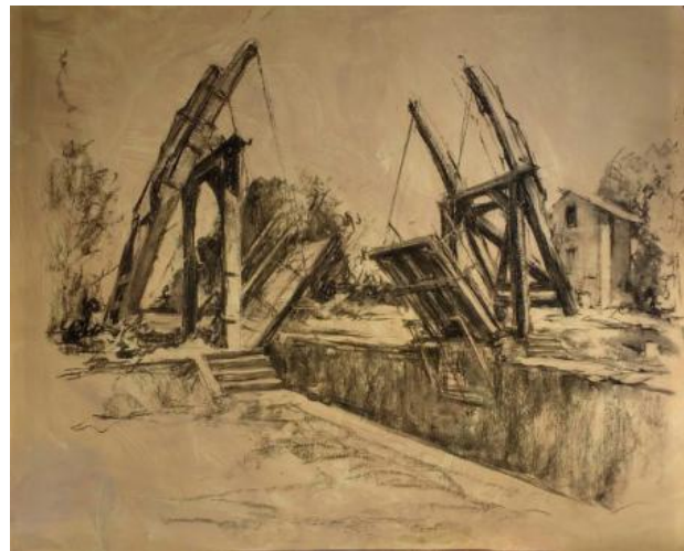
Pont de Langlois, 2018 pastel and charcoal on paper, 70 x 90 cm