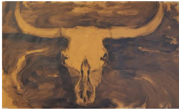
Waterbuffel op papier, 2020 acrylverf op papier, 40 x 60 cm.