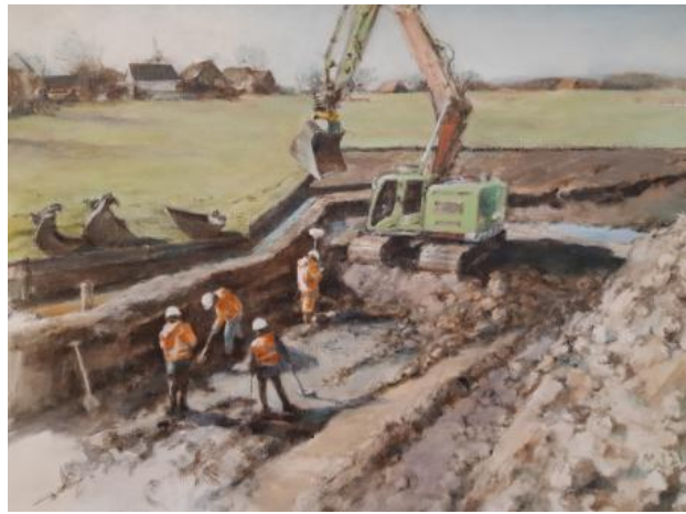
Overzicht , 2021 olieverf op doek, 60 x 80 cm.