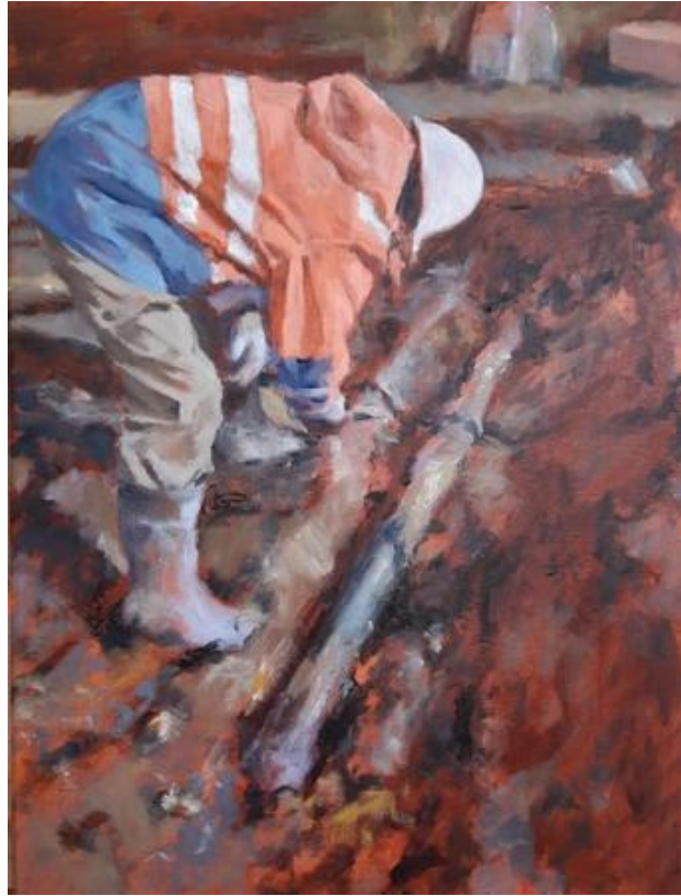
excavation of a historic rifle, 2021 olie op canvas, 40 x30 cm