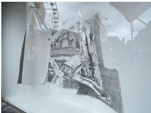
Maalstroom etude M, 2023 frottage met grafiet, uitsnede en gescheurd papier, 210 x 10 x 120 cm