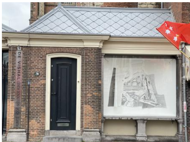
Maalstroom etude M, 2023 frottage tekening met grafiet met wit en grijs papier, 210 x 10 x 120 cm