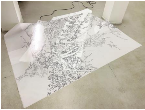
Darstellung einer Rosskastanie, 2022 mixed media, 200x250x10cm