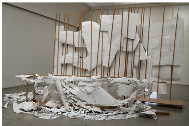
maelstrom, 2019 andere kant met sjabloon maalstroom onderdeel van de site specific installatie, 8m x 6m x 3m