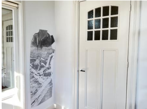
Vessel, 2021 rubbings and graffite drawing, 65 x1x160 cm