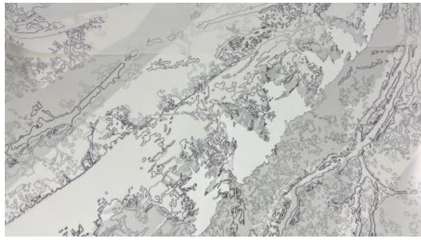
Darstellung einer Rosskastanie, 2022 mixed media, 200x250x10cm