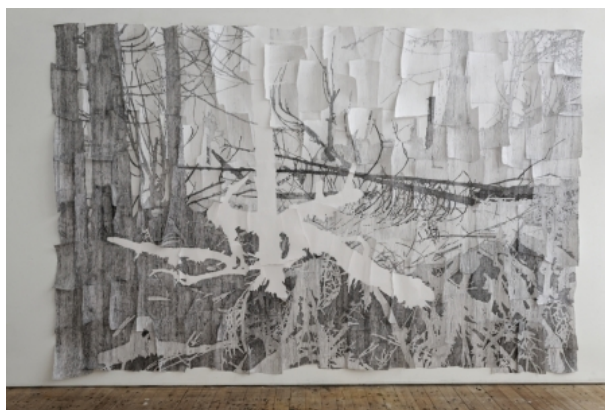
Hybrids present, 2017 Installatie van grafiet op papier, 275x400x10