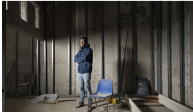
Skatepark Sweatshop 6|7|8 oktober binckhorstlaan 275, 2317BB Den Haag 5 oktober premiere alleen op uitnodiging

4 delen gewapend gestort beton, in aarden cirkel diameter 12m, gewicht: 4x3 ton = 12 ton, 4.60x.4.60x0.60H