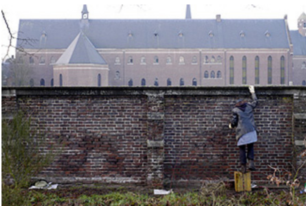
voegen van 364,80 meter kloostermuur, 2016 vanaf 03 maandelijks met de hand voegen, L.364,80m