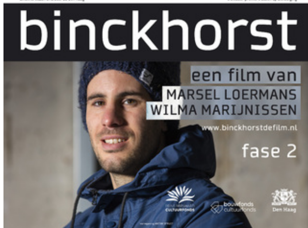
documentaire binckhorst de film, fase 2, 2017