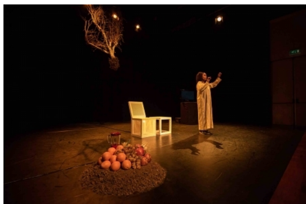
Gnaoui Goed Gedaan, 2015 toneelbeeld granaatappelboom zitelemente