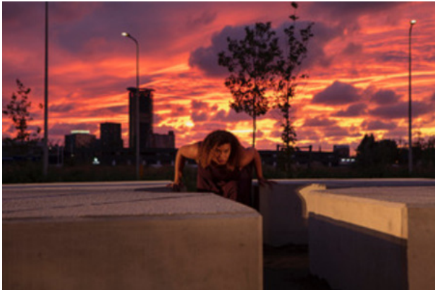
TERRA MATER, 2018

2000 - trainingen Beeldende Vorming voor 2022 onderwijs en welzijn