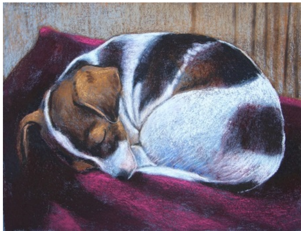
Slapen, 2019 pastel , 23x30 cm