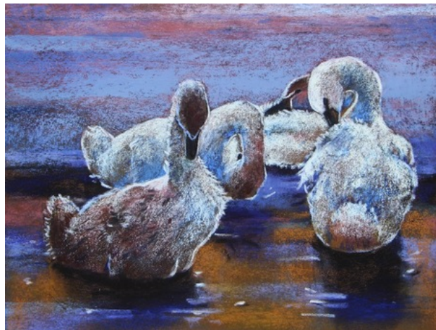
Jonge zwanen, 2019 pastel , 23x30 cm