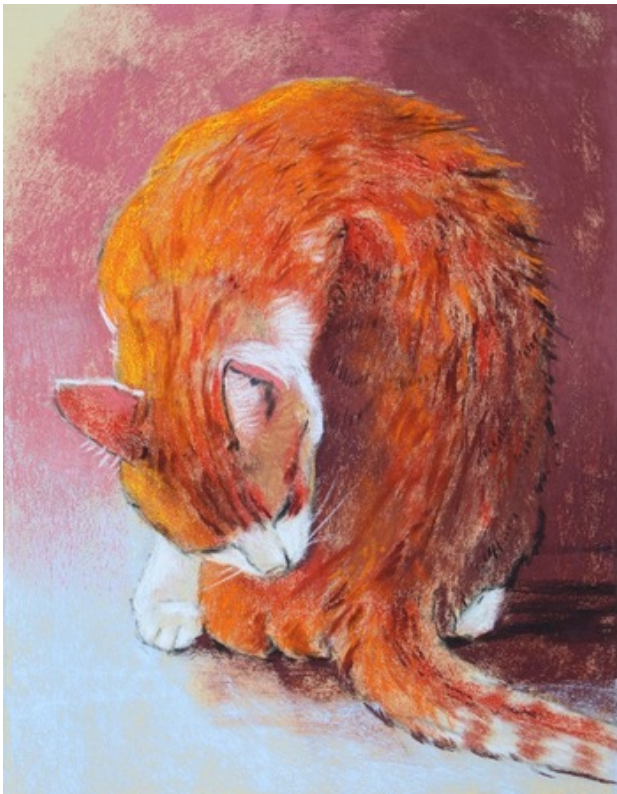
Poes, 2019 pastel , 30x23 cm