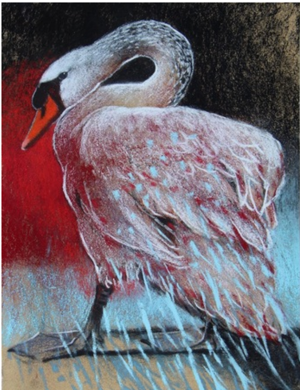
Zwaan, 2019 pastel , 30x23 cm