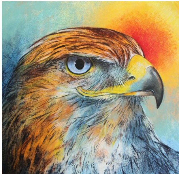
Arend, 2019 pastel op paneel, 40x40 cm