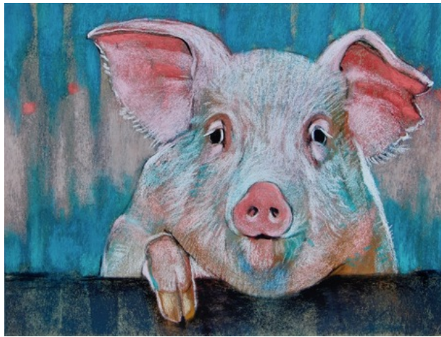
Varken, 2019 pastel , 23x30 cm