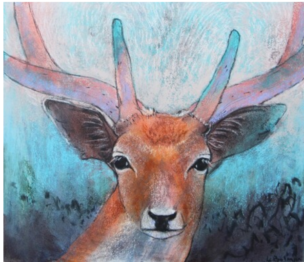
Hert, 2019 pastel op paneel, 23x38 cm