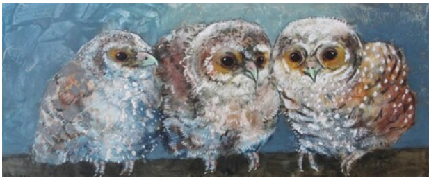
Drie op een rij, 2019 pastel op paneel, 23x60 cm