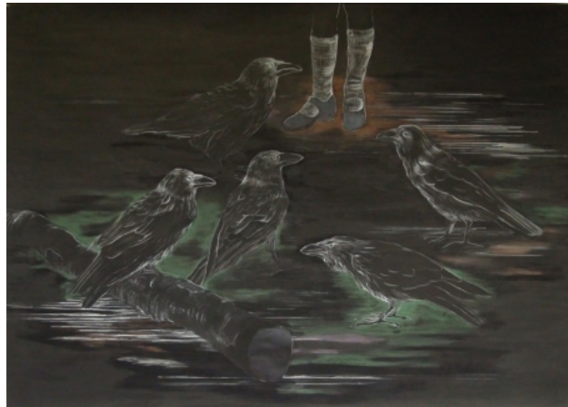
Klein meisje met grote vogels, 2010 gemengde techniek op papier, 147 x 208 cm