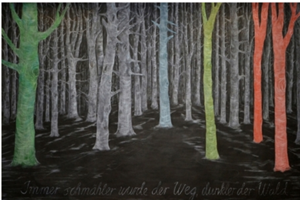
Im Walde, 2014 gemengde techniek op papier, 190x210