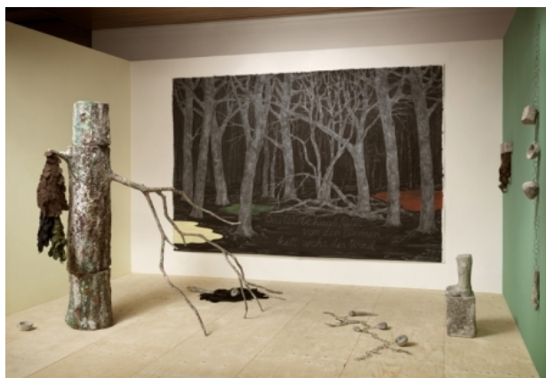
Time past in time present, 2017