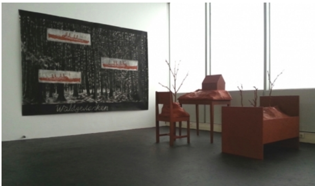
Stuhl, Tisch, Bett., 2015 div. materialen