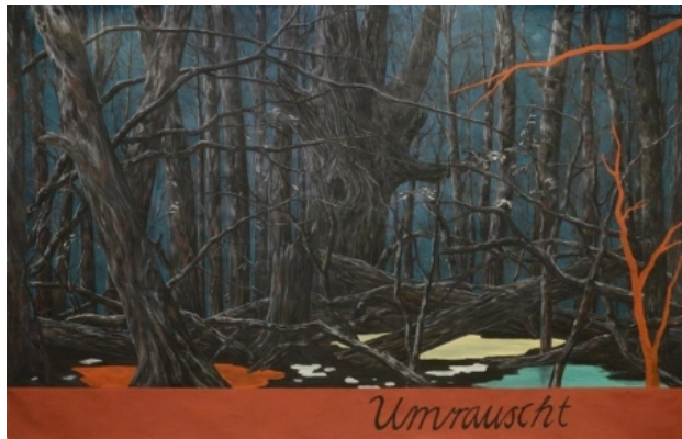
Umrauscht, 2015 gemengde techniek op papier, 2010x310 cm