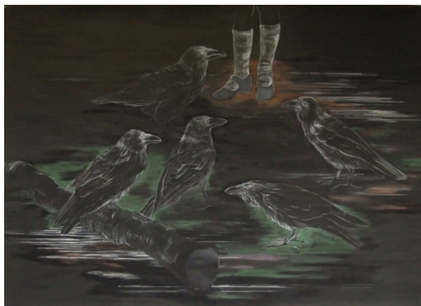
Klein meisje met grote vogels, 2010 gemengde techniek op papier, 147 x 208 cm