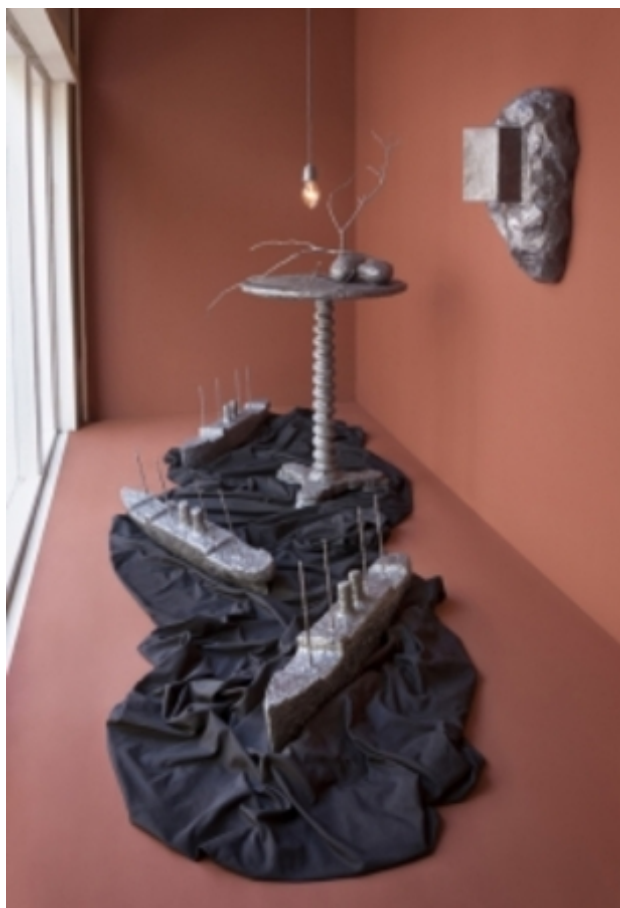
Night crossing, 2017 div materialen

2005 - -- secretaris stichting Ruimtevaart On- going