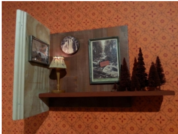
Wasserfalle, 2015 div. materialen