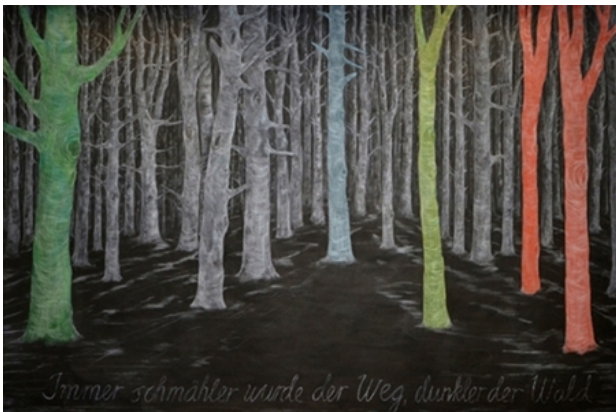
Im Walde, 2014 gemengde techniek op papier, 190x210