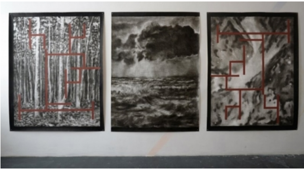
zonder titel, 2013 gemengde techniek op papier, 200x150 cm