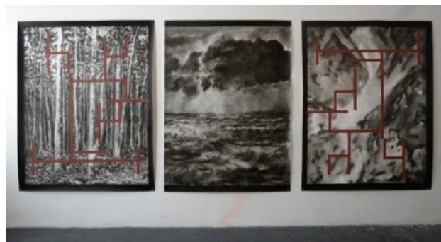
zonder titel, 2013 gemengde techniek op papier, 200x150 cm