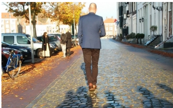
tonsure, 2015 performance