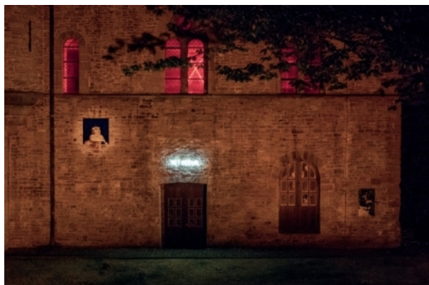
De glans van het geweten, 2018 dives