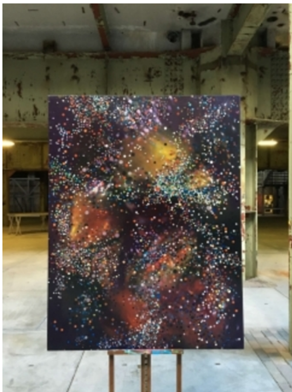
zt, 2015 olie op linnen, 180 x120