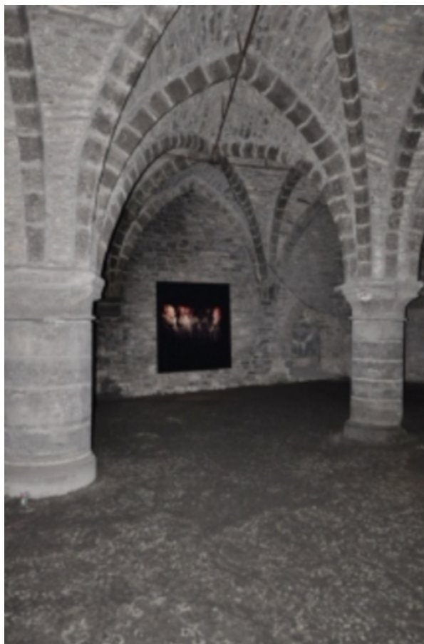
op zoek naar Geeraard, 2018 print op dibond