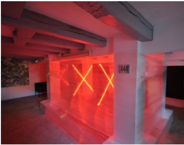
niet twee, 2015 neon, folie