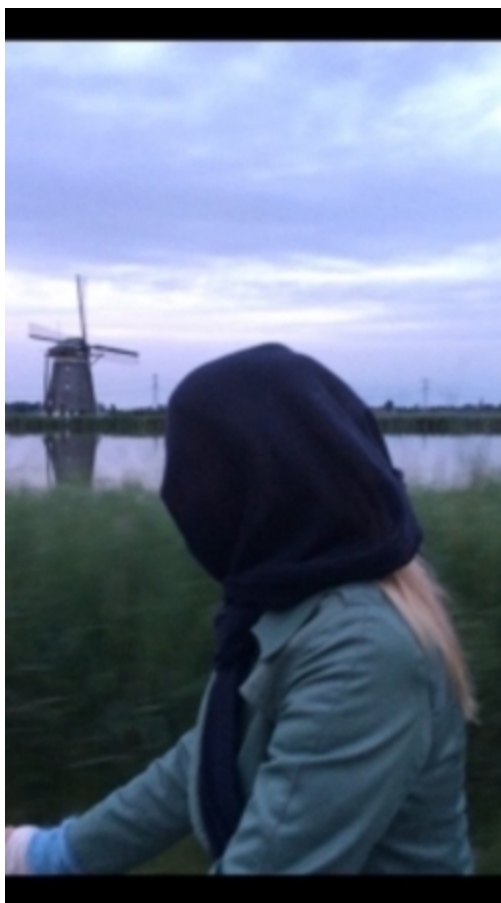
verdeeld landschap, 2015 video