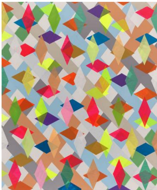
zt, 2022 divers op linnen, 50x70