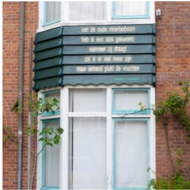
geveltekst, 2011 bladgoud