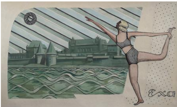
Acht Schwestern (III), 2019 gouache, 31,5 x 52,5 cm