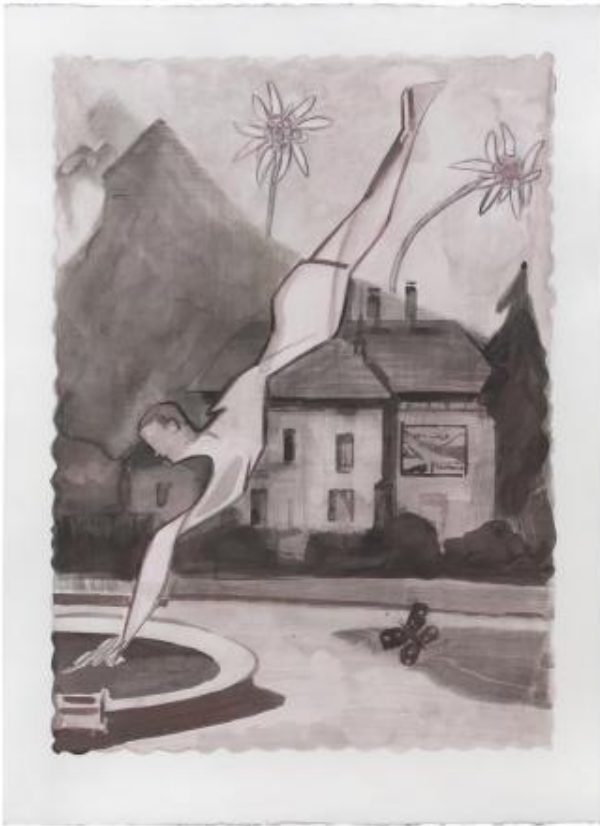
Ballade (V), 2021 inkt en kleurpotlood, 76 x 56 cm

-- -- -- illustratiewerkzaamheden On-going