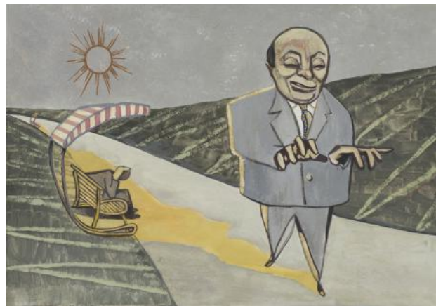
Elf Brüder (III), 2019 gouache, 30 x 48 cm