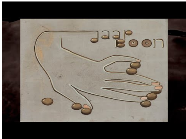
Jaap Boon, 2020 29:55