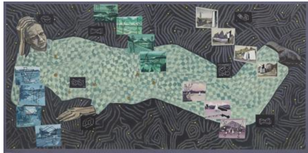
Mon Frère, 2021 acryl op papier, 300 x 150 cm