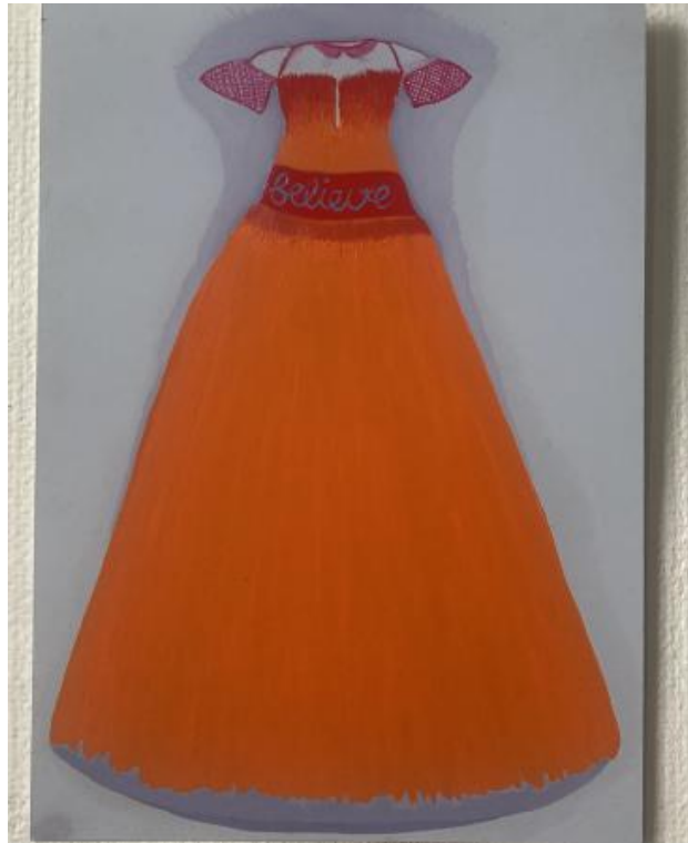
'believe', 2024 oli on paper, 21 x 14,8 cm.