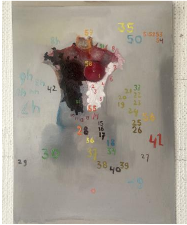
z.t., 2024 oli on paper, 21 x 14,8 cm.