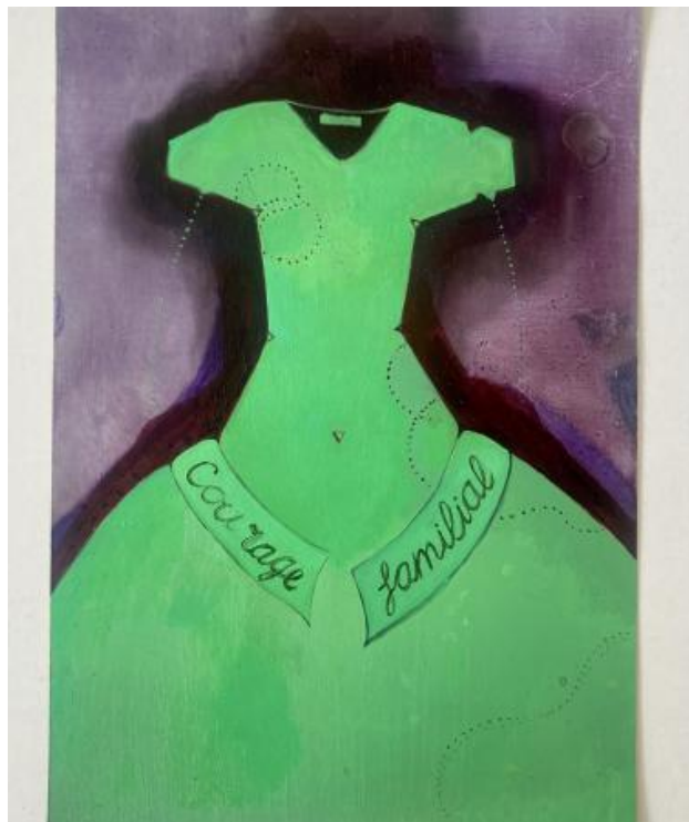
'courage familiale', 2024 oil on paper, 21 x 14,8 cm.