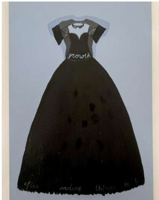
'growth', 2024 oil on paper, 21 x 14,8 cm.