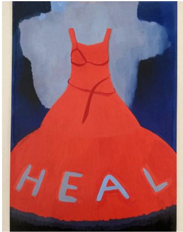
z.t., 2024 oli on paper, 21 x 14,8 cm.