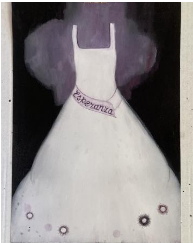
'Esperanza', 2024 oil on paper, 21 x 14,8 cm.