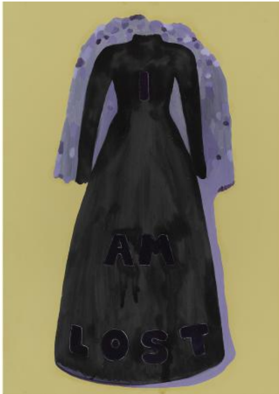
z.t., 2024 oli on paper, 21 x 14,8 cm.