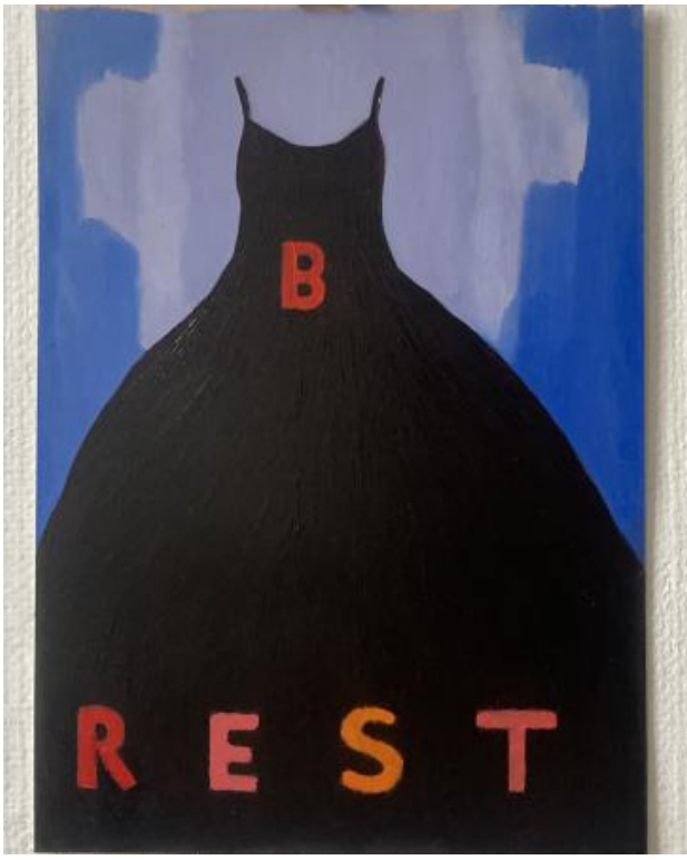
z.t., 2024 oli on paper, 21 x 14,8 cm.