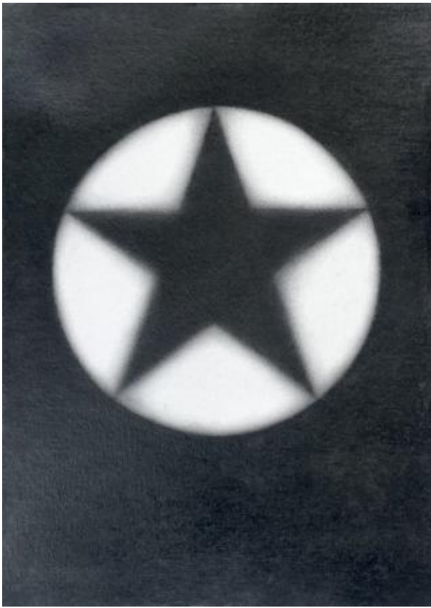
z.t., 2022 0,3 mm potlood op papier, 30 x 21 cm.