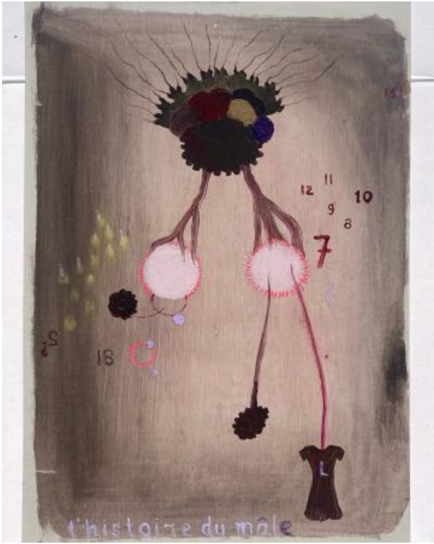
'l'histoire du mâle', 2024 oli on paper, 21 x 14,8 cm.