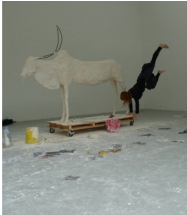
I always make a detour to see it, 2012 plaster, person, wood, iron