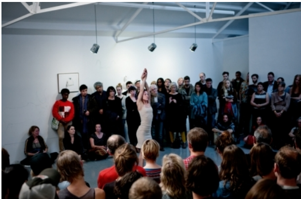
the restless gods, 2014 performance