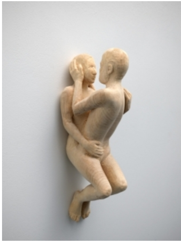
, 2014 limewood