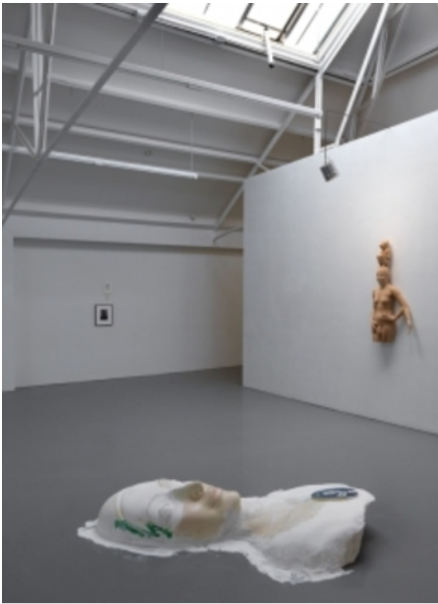
and live is over there, 2014