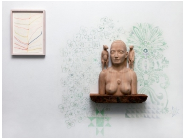
if you were coming in the fall, 2012 linden hout, acryl op de muur