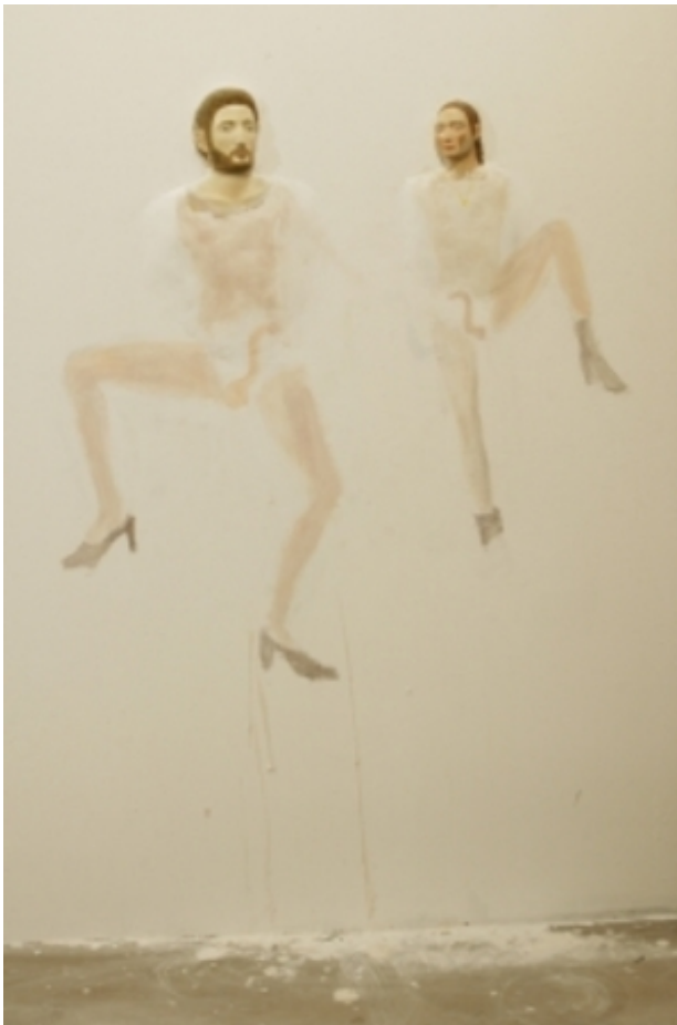
untitled, 2012 hout, gips, oil color, dimensions of the