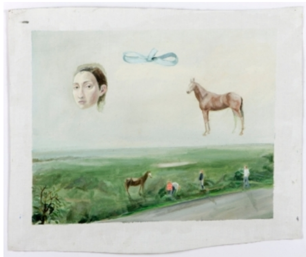
untitled, 2013 olieverf op linnen