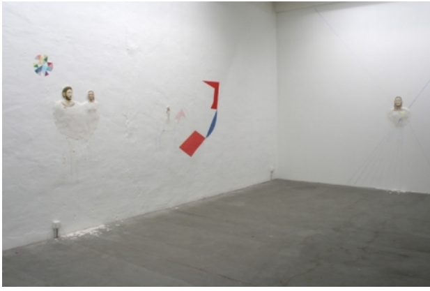
the seven joys of mary, 2010