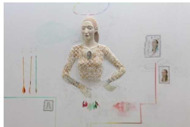
new myth for new family, 2011 hout, gips, oil color, dimensions of the