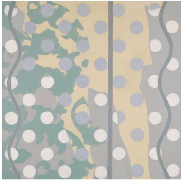
Untitled, 2022 Acrylic on wood panel, 30 x 30 cm