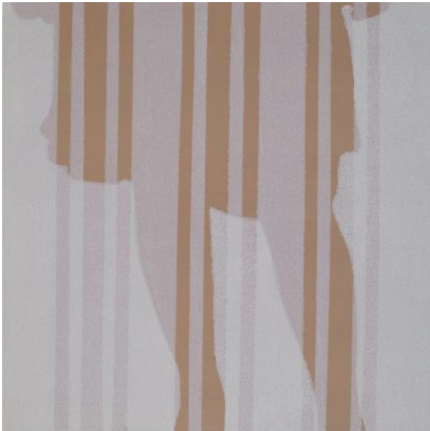
Untitled, 2022 Acrylic on wood panel, 30 x 30 cm