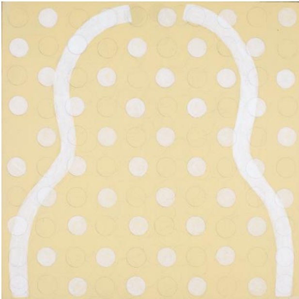
Untitled, 2022 Acrylic on wood panel, 30 x 30 cm