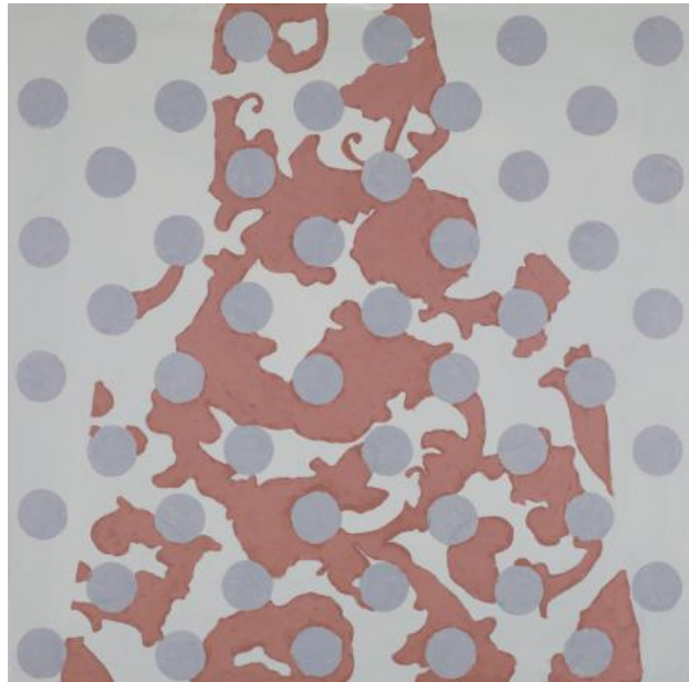
Untitled, 2022 Acrylic on wood panel, 30 x 30 cm