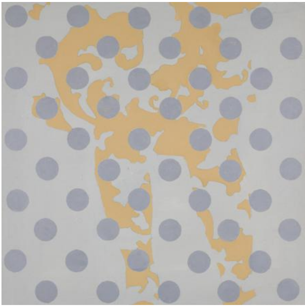
Untitled, 2022 Acrylic on wood panel, 30 x 30 cm