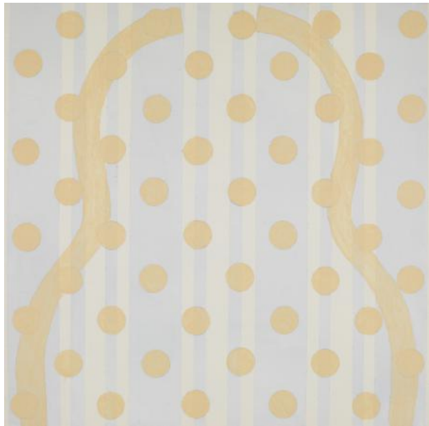
Untitled, 2022 Acrylic on wood panel, 30 x 30 cm