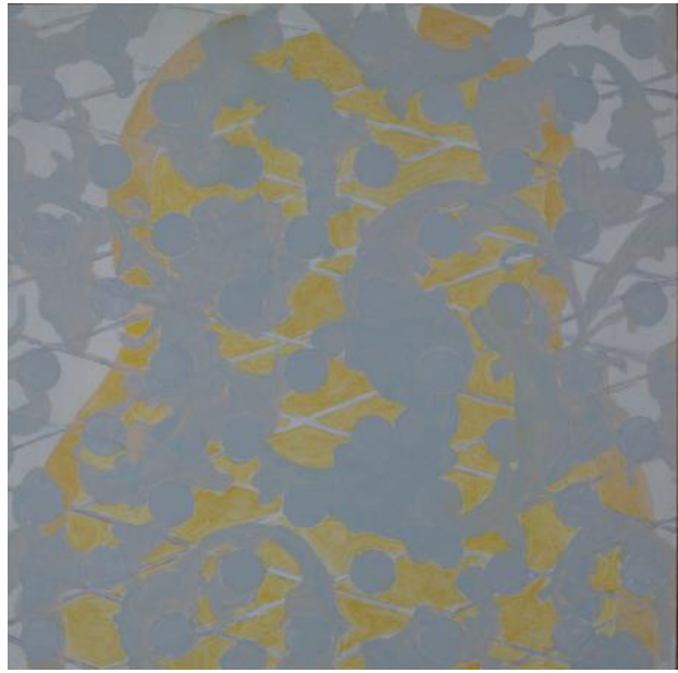
Untitled, 2022 Acrylic on wood panel, 30 x 30 cm