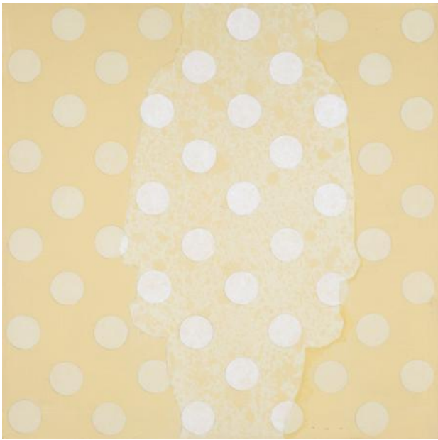
Untitled, 2022 Acrylic on wood panel, 30 x 30 cm