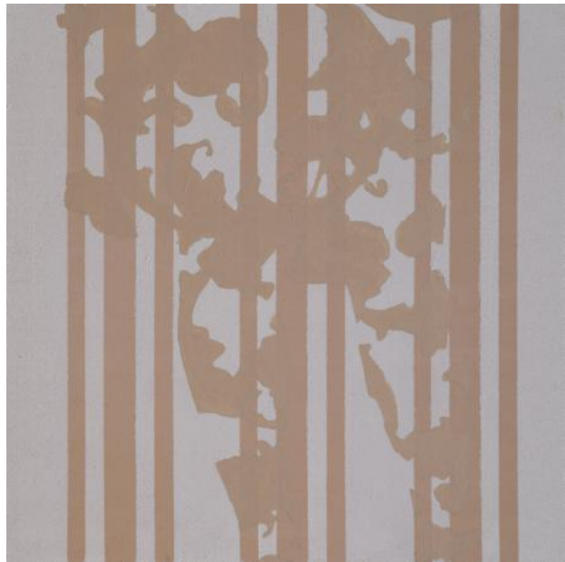
Untitled, 2022 Acrylic on wood panel, 30 x 30 cm