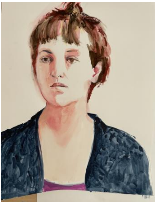
Loona, 2022 gouache, 70cm x 50cm

2018 - -- organisatie van modeltekengroep HKK On-going