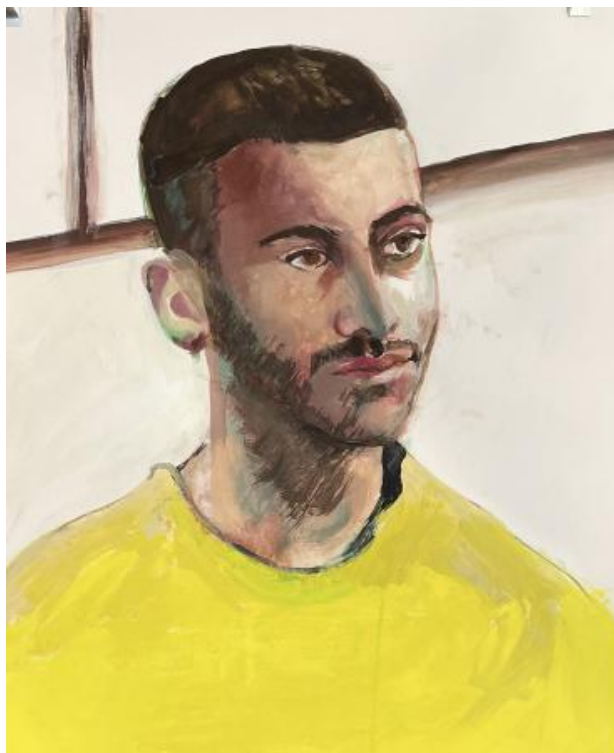
Moris, 2022 gouache, 70 cm x 50 cm