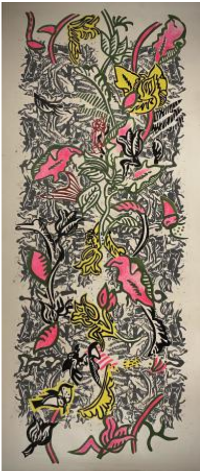
geen titel, 2021 silkscreen afdruk acryl en inkt schilderen, 140cm x 250 cm