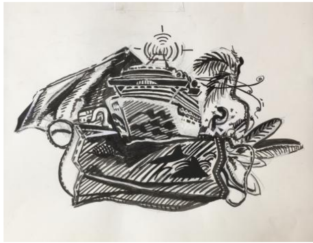
covid1, 2021 inkt tekening, 50cm x 37cm