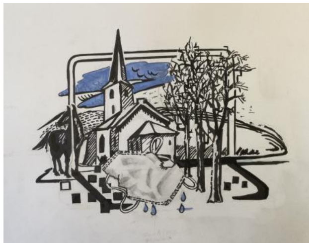
covid2, 2021 inkt en gouache tekening, 50 cm x 37cm