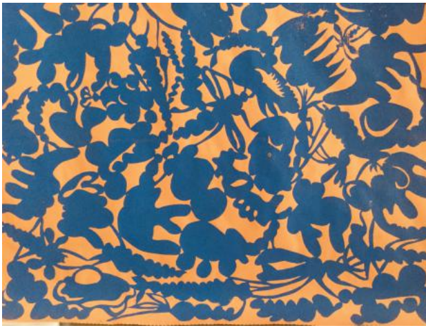
larve, 2020 lindruk op pakpapier, 60cm x 80cm