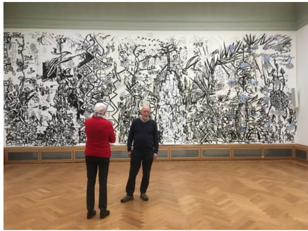
Blik op Candide, 2019 tekening/schildering, 400cm x 1040cm