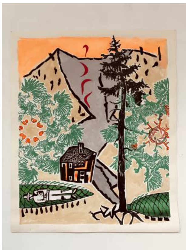
HKK kerstshow, 2022 acryl, inkt, 140cm x 120 cm