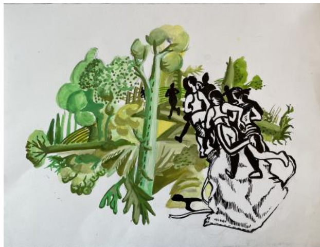
covid4, 2021 inkt en gouache tekening, 50cm x 37cm