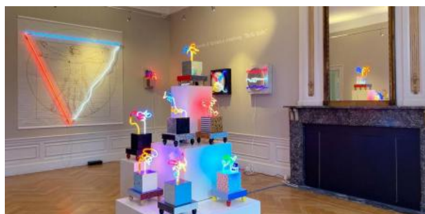
Il mio mondo di fantasia e creativit. , 2021