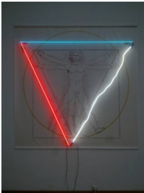
Luce universele dia Vinci, 2015 Grafiek neon, 200x200 cm