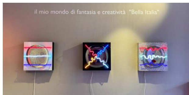
Bella Italia , 2021