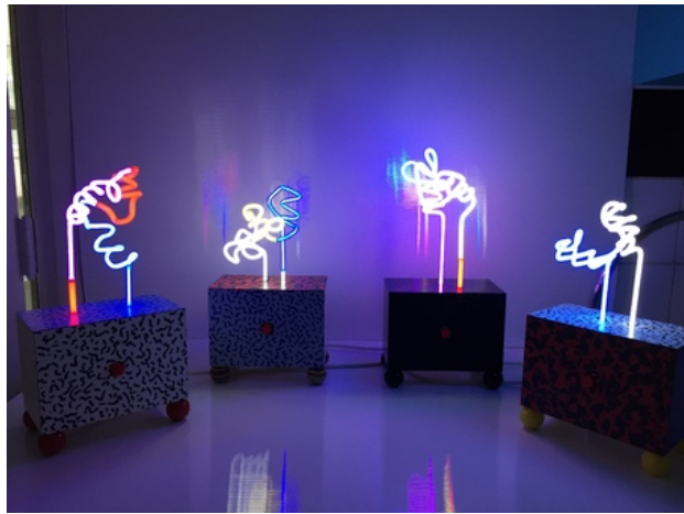
3Dneon mini , 2020 mini 3dneon , 10x10x17 c