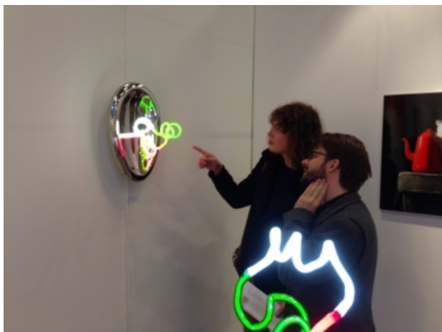
Art THE Hage, 2016 RVS neon, 60x35 x30