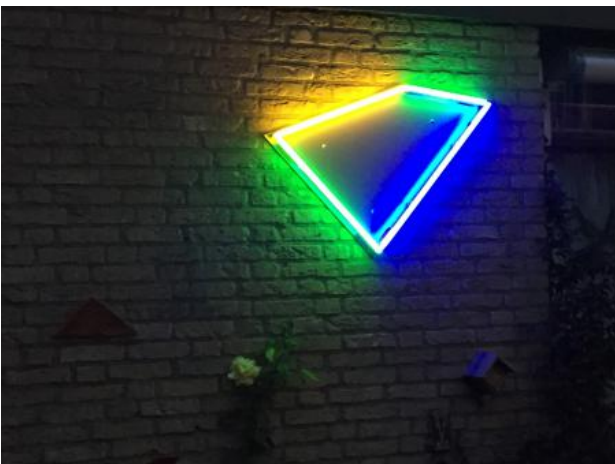
Four corners , 2020 Neon kunststof , 90x90x10