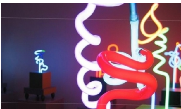
div 3Dneon, 2015 neon div , 35x35x55