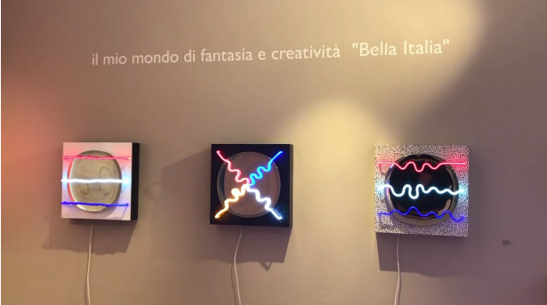
trim.1C353BB7-0831-4F92-B9D7-1D2069721083, 2021 3.15