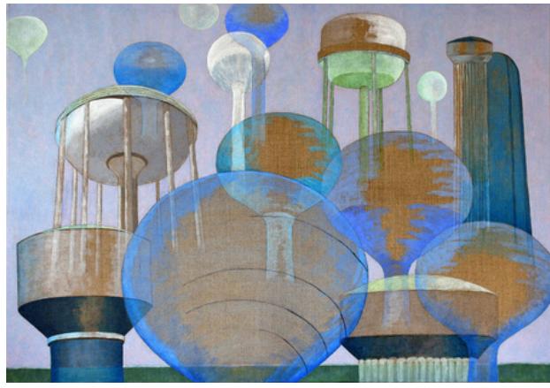
'Water Towers USA', 2015 Acrylic on canvas. , 95x65 cm