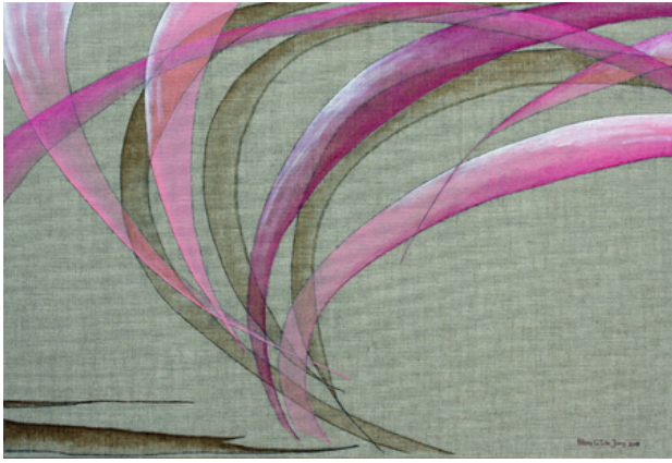
'My Japanese Cherry' , 2018 Acrylic on canvas., 65x95 cm