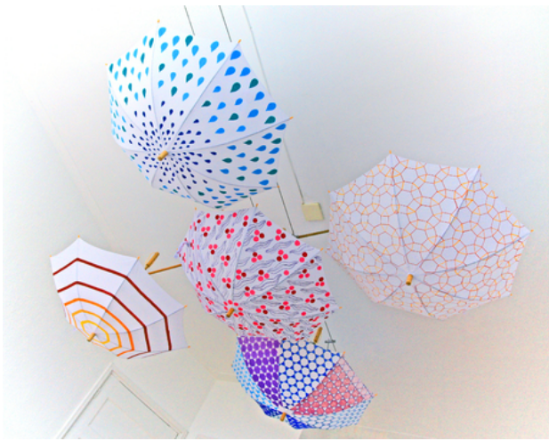
Installatie, 2018 Mixed media