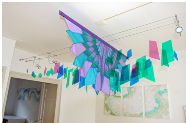
Fandance, 2014 Mixed media