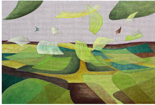
'Flying Out of a Pattern III', 2018 Acrylic on canvas. , 65x95 cm