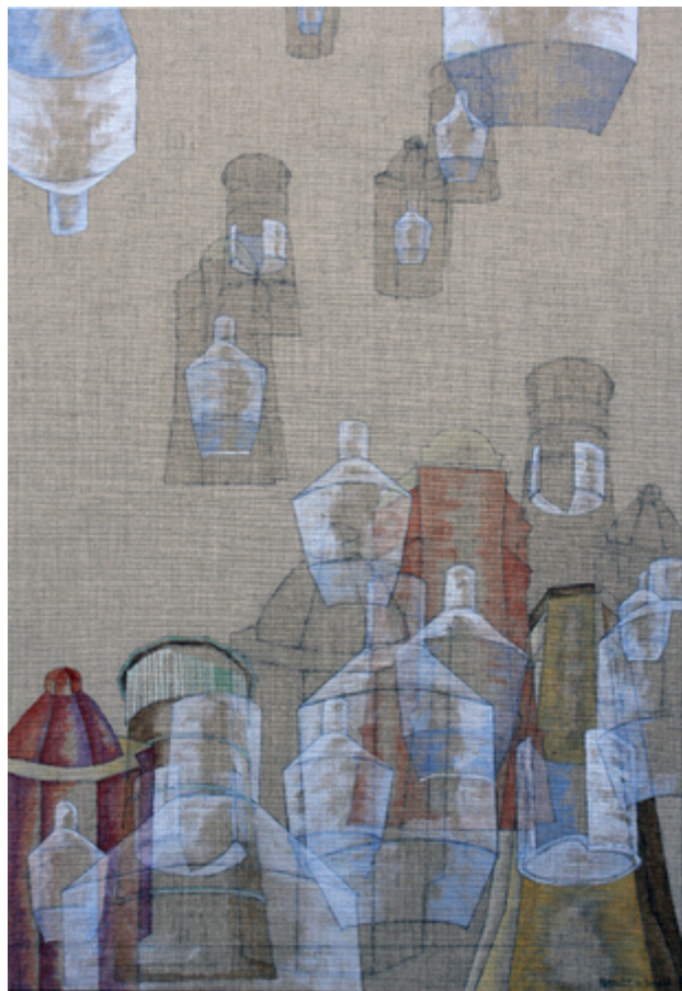
'Water Towers Holland', 2016 Acrylic on canvas. , 95x65 cm