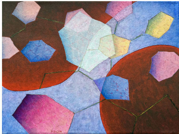
'Flying Out of a Pattern I'. , 2014 Acrylic on canvas. , 30x40 cm