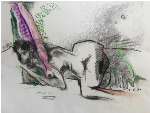
sans titre, 1980 tekening, 50x65