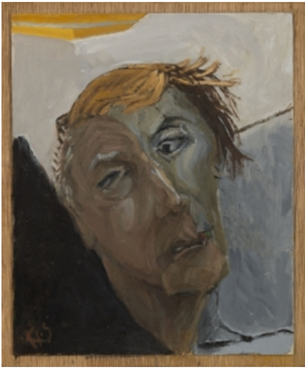
Obisag, 2017 olieverf op paneel, 35x25