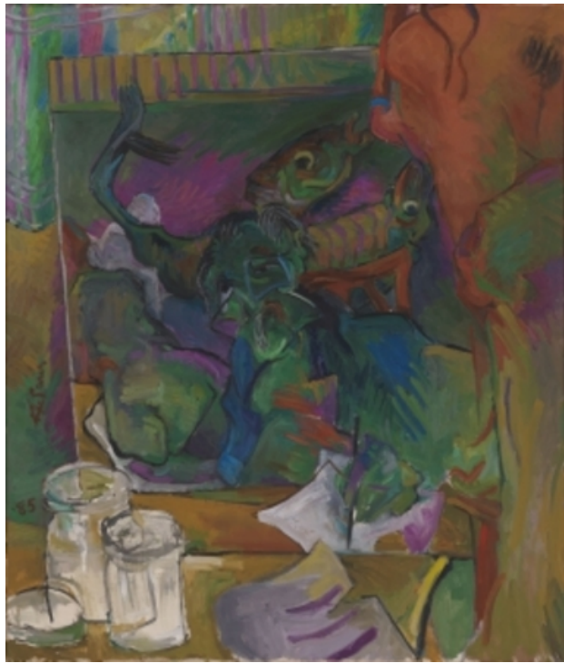
de jampotten van Gauguin, 1981 olieverf op doek, 100x85