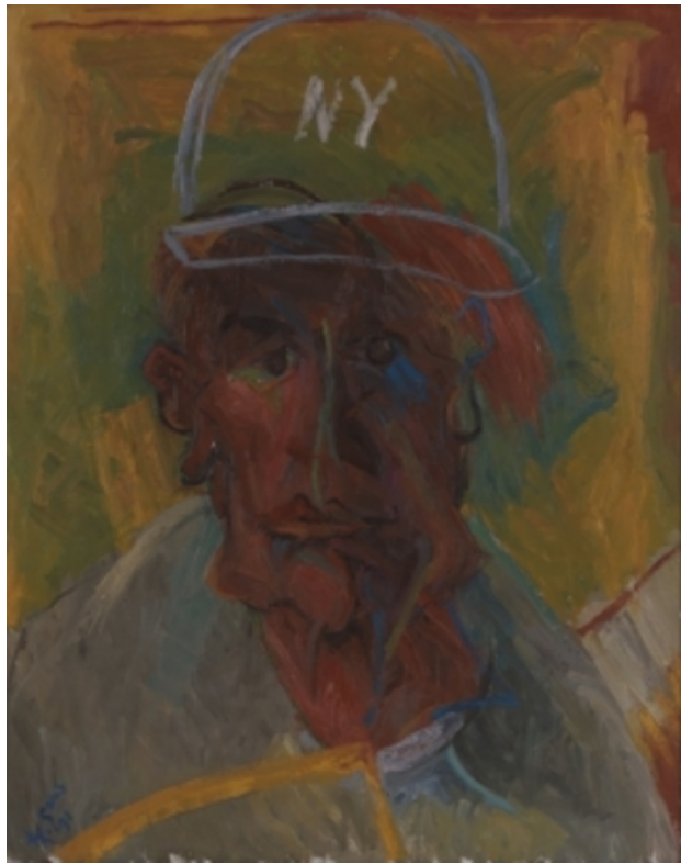
le roi de New York, 1991 olieverf op doek, 80x60