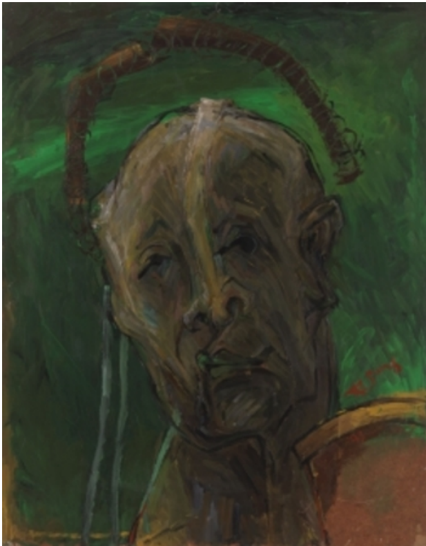
de strijder, 1993 olieverf op doek, 65x50