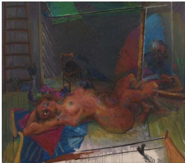
Condrowisz, 1984 olieverf op doek, 100x110