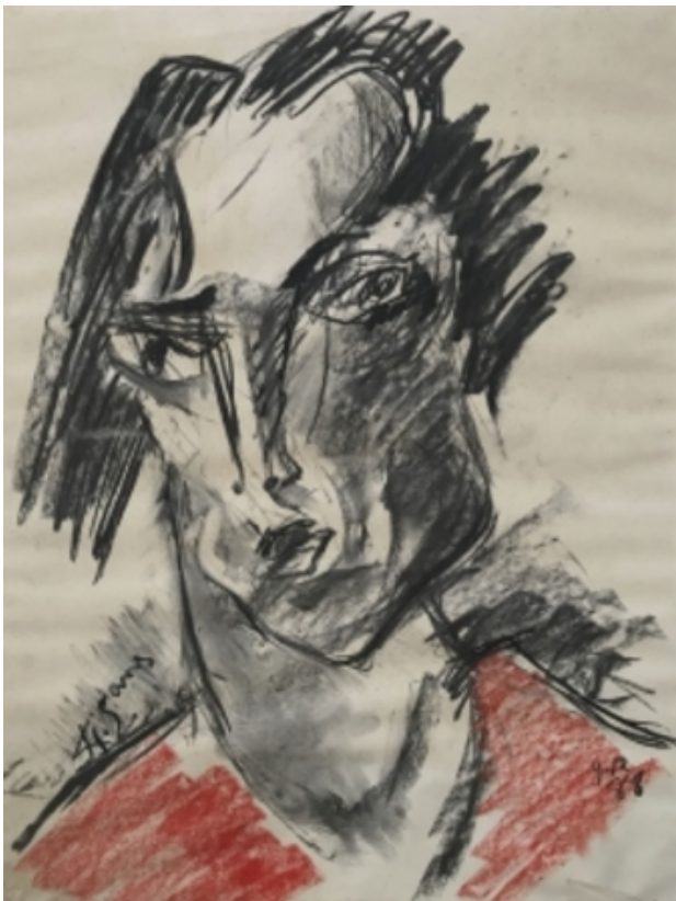
visage, 1988 tekening, 65x50