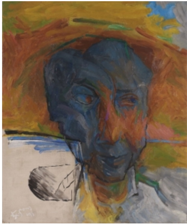
o.a. un vi-pay-sage, 1993 olieverf op doek, 60x50