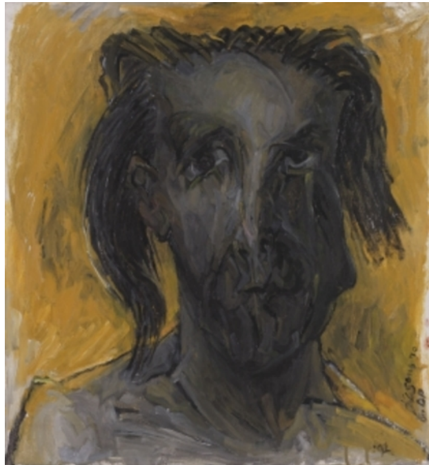
Toi, 1991 olieverf op doek, 70x60