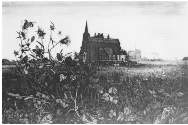
Abdijkerk Loosduinen, 1975 ets, 20x30