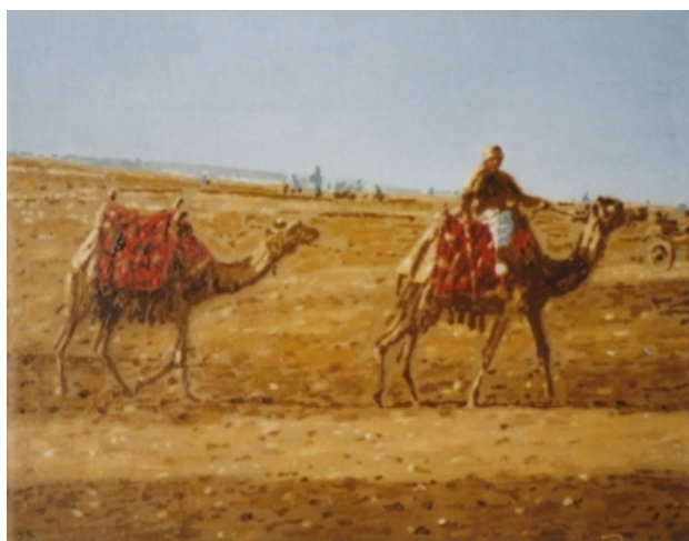
kamelen in de woestijn, 2007 olieverf, 24x30