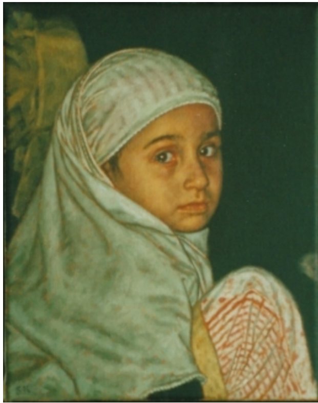
Egyptisch meisje, 2001 olieverf, 30x24