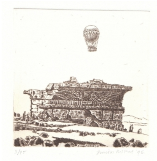
Ballonvaarders in Egypte, 1996 ets, 10x10