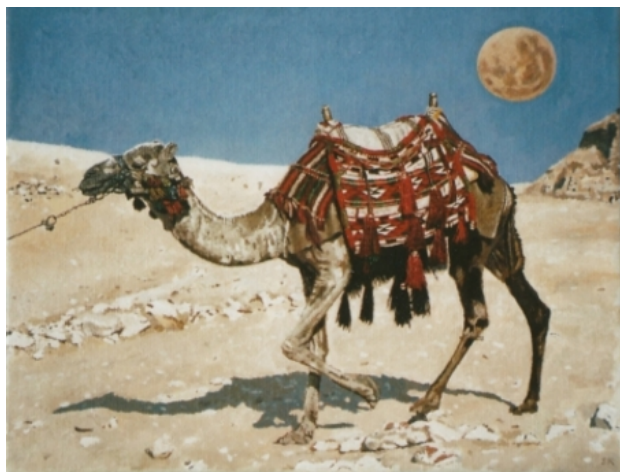
Kameel met rode planeet, 2008 olieverf, 24x30

1979 - Docent aan de Koninklijke Academie van 2011 Beeldende Kunsten, Den Haag