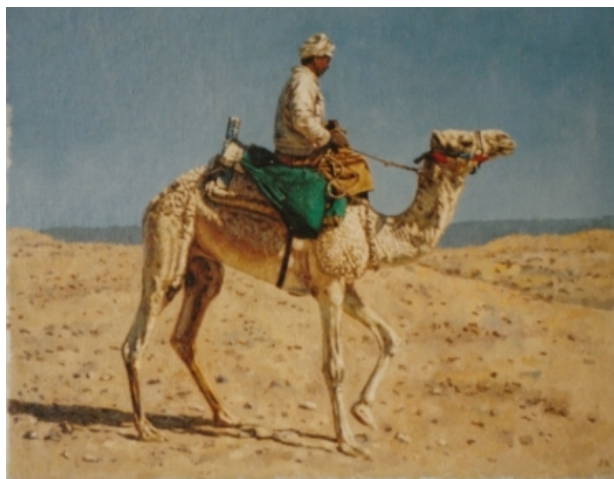
Jongetje op kameel, 2007 olieverf, 24x30