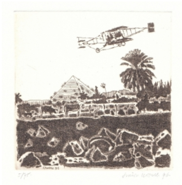
De eerste vlucht, 1996 ets, 10x10