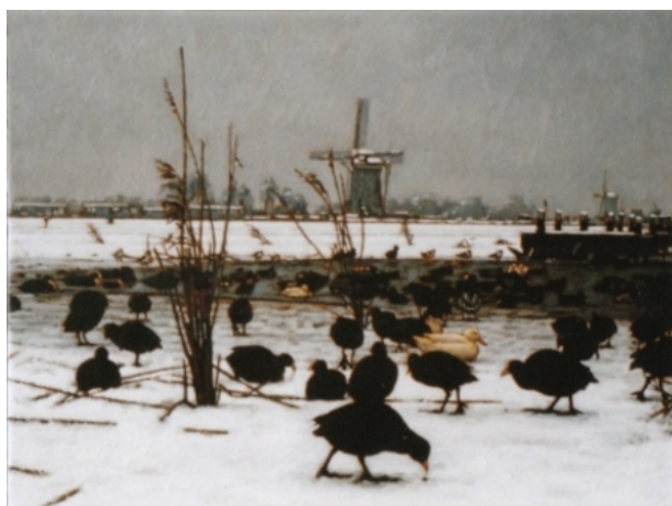
Het wak, 2006 olieverf, 30x40