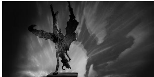
Blinded by the light, 2020 brons, 40/45 cm