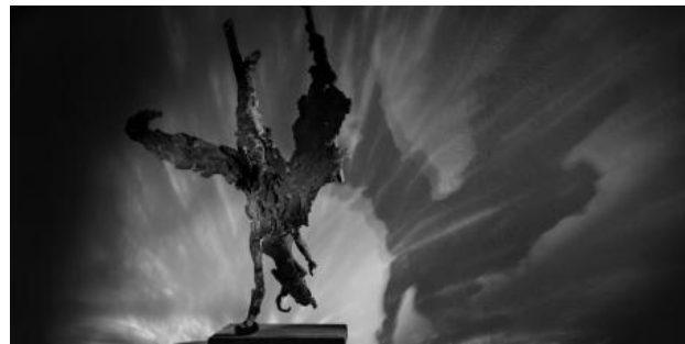
Blinded by the light, 2020 brons, 40/45 cm