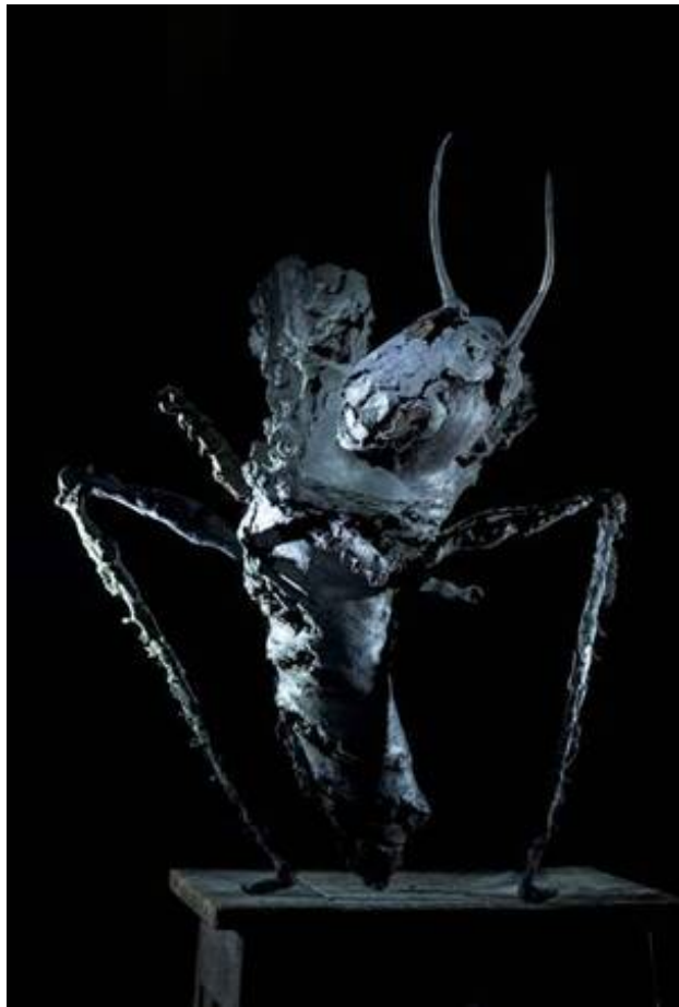
Grasshopper, 2018 brons, 100 x 80 cm.