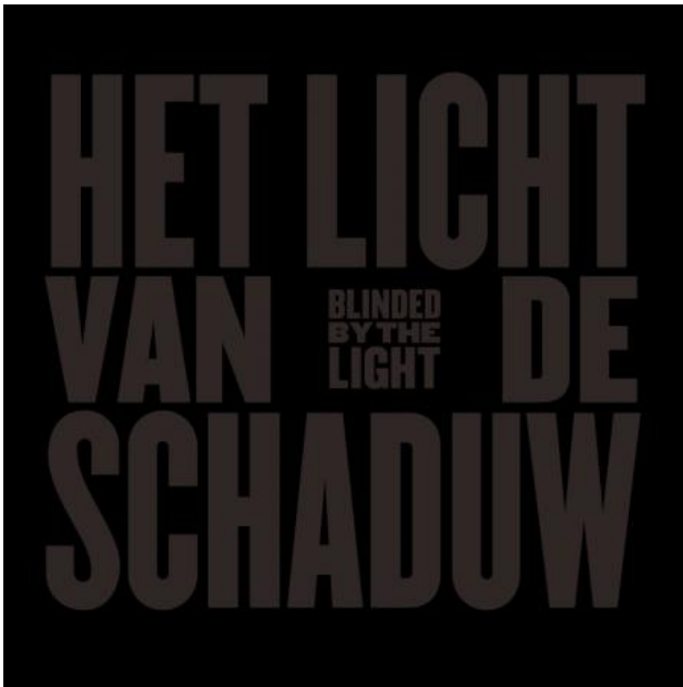
Blinded by the light (het licht van de schaduw), 2024