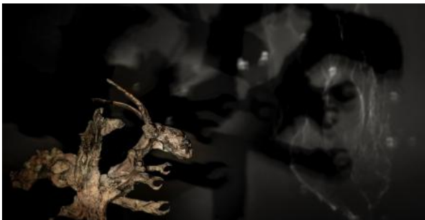
Blinded by the light, 2023 brons en licht, 2.00 x 2.00 x 2.00