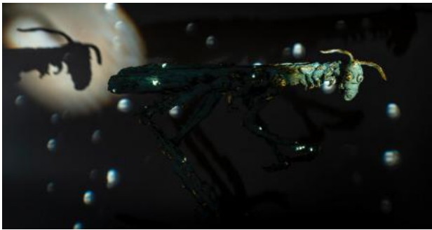
Horizontale sprinkhaan, 2023 brons en goud, 60/60 cm