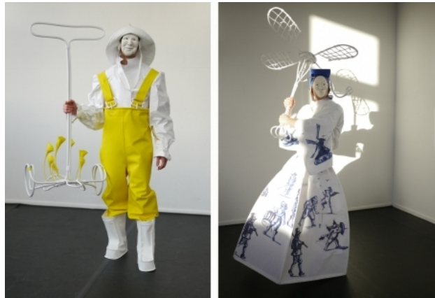
7 verschijningen, 2017 performance, 75 min.