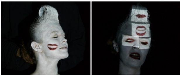
Feed, 2015 performance, 30 minuten