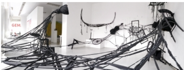
Gevallen kamers #2, 2014 diverse ruimtelijk, 6mx8m