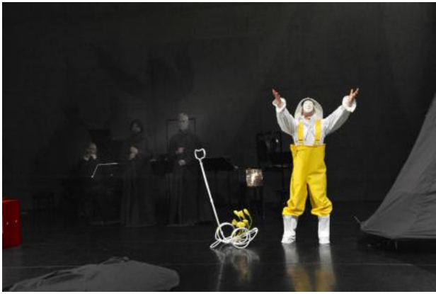
De optocht, 2018

De Optocht, 2018 verschillende technieken beeld en beweging