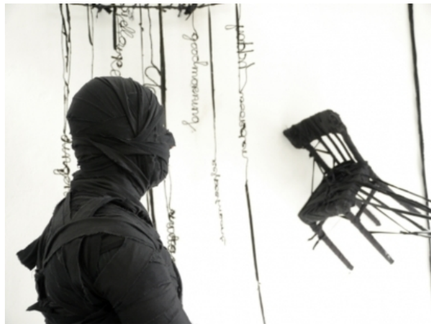
Gevallen kamers video, 2014 video, 3,5 minuten.