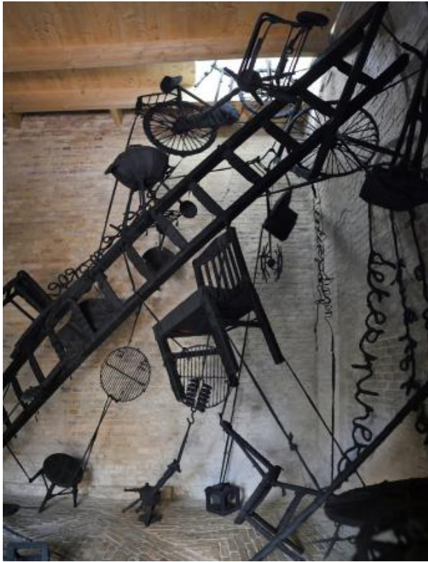
Gevallen Kamers 3, 2022 objekten omwikkeld met stof, gehangen , aan elkaar geknoopt, speciale inrichting., Torenruimte 4m x4m x 4m