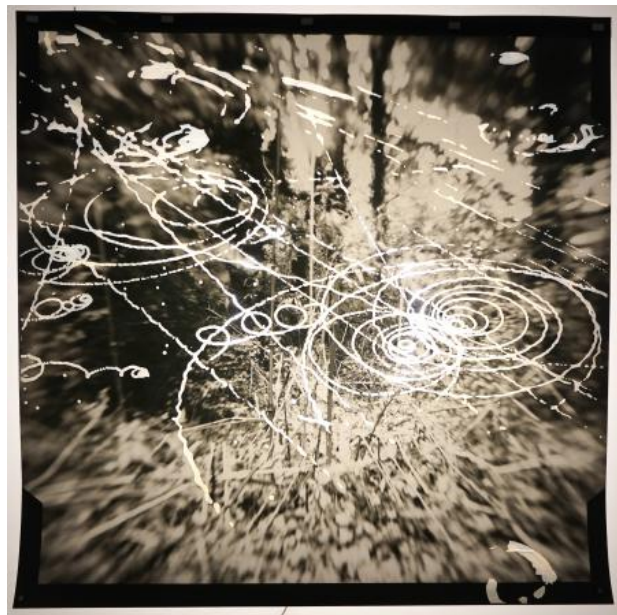
Exposed landscape, 2023 foto op papier met toegevoegde cloudchamber middels lasercutter, neon licht, 80x80 cm