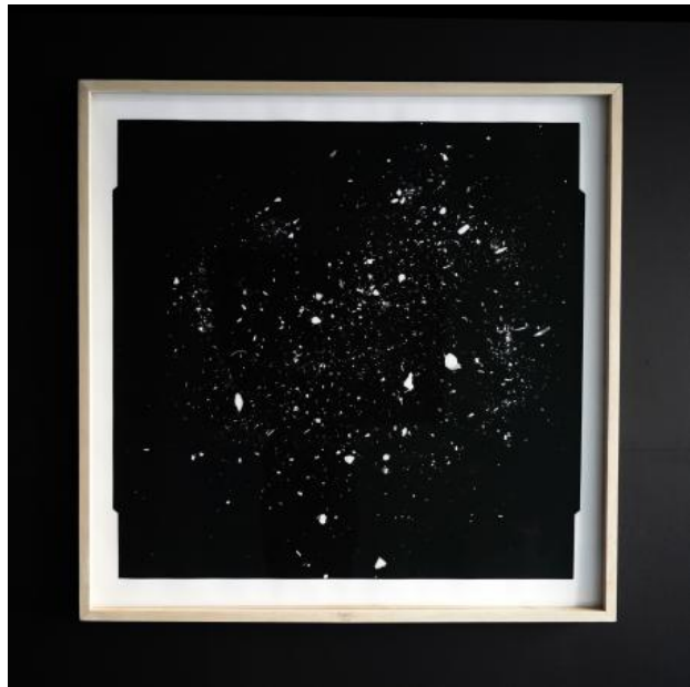
Dust, 2021 contactafdruk op barietpapier en uitvergroot op art- paper, 90 x90 cm