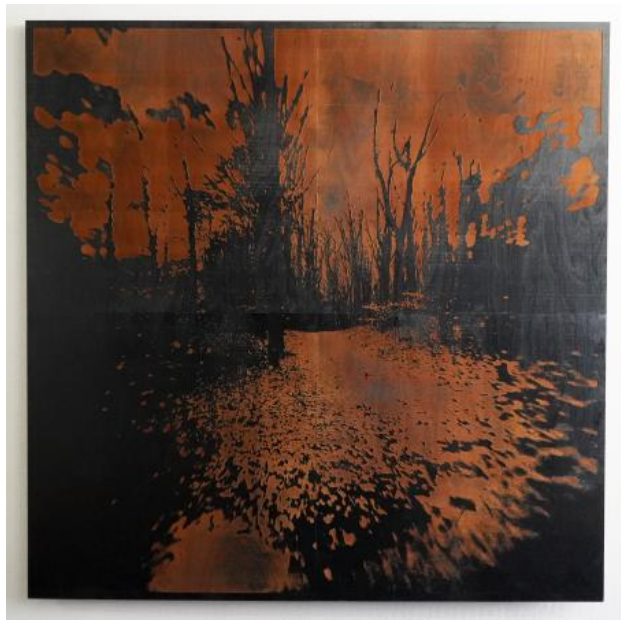
Unsettling landscape, 2022 fotografie en lasercutter, 150x150 cm