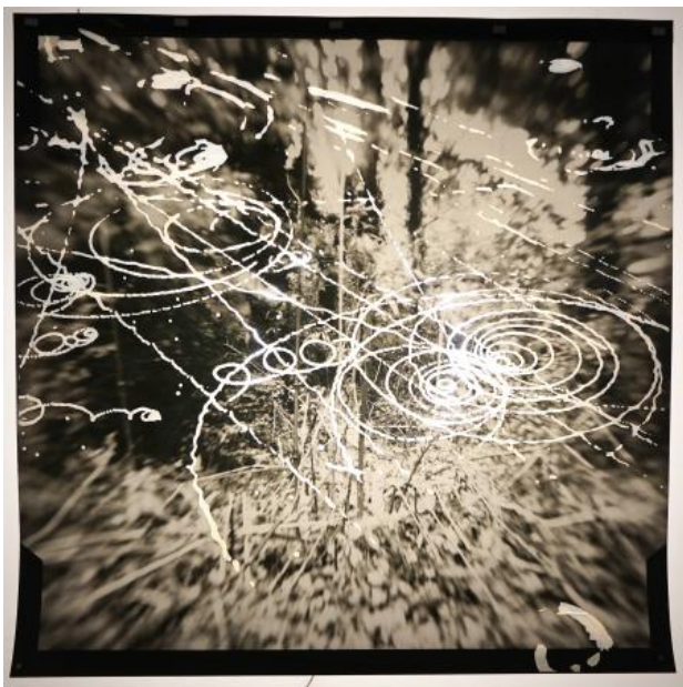
Exposed landscape, 2023 foto op papier met toegevoegde cloudchamber middels lasercutter, neon licht, 80x80 cm