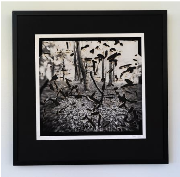
cloudchamber#3, 2023 foto op barietpapier, bewerkt met lasercutter, 30x30 cm