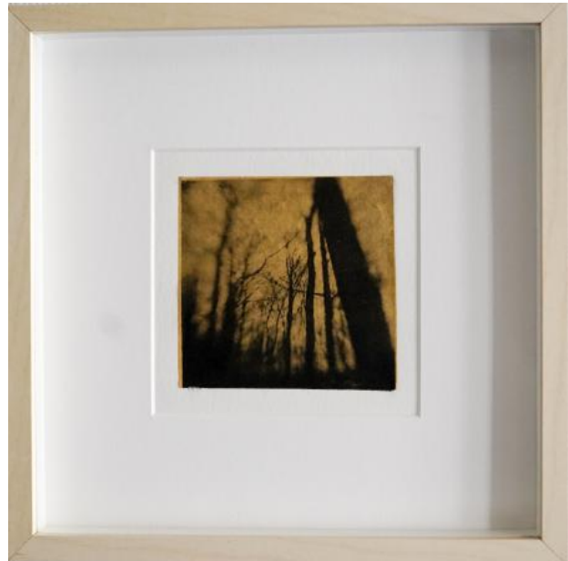
unsettling landscape a, 2021 toyobo/chine colle, 20x20cm