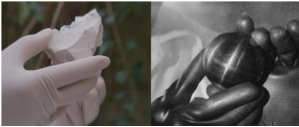
Unsettling Dust, 2021