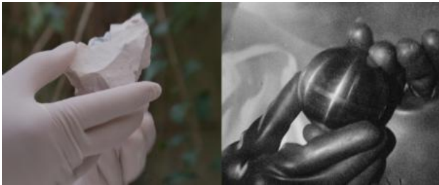
Unsettling Dust, 2021