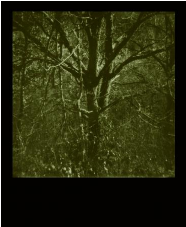
Exposed Landscape, 2021 polaroid op aluminium, 60x73cm