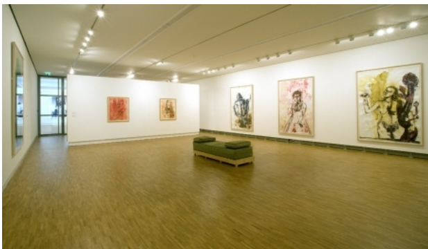
De Ideale Moslimvrouw, 2006