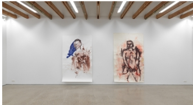
Je suis toi-tu es moi, 2017 aquarel op papier, 255 x 152