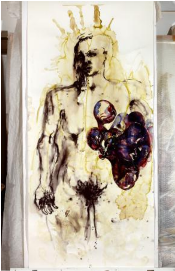
, 2020 watercolour on paper, 245 x 114 cm