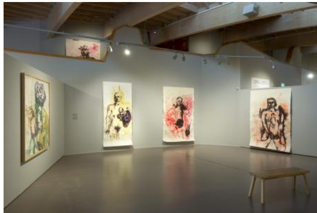
The wound is the place where the light enters you, 2021