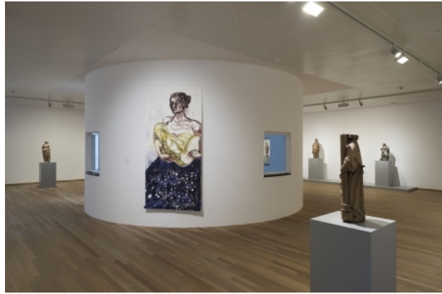
Bonnefantenmuseum, 2015 aquarel/potlood/papier