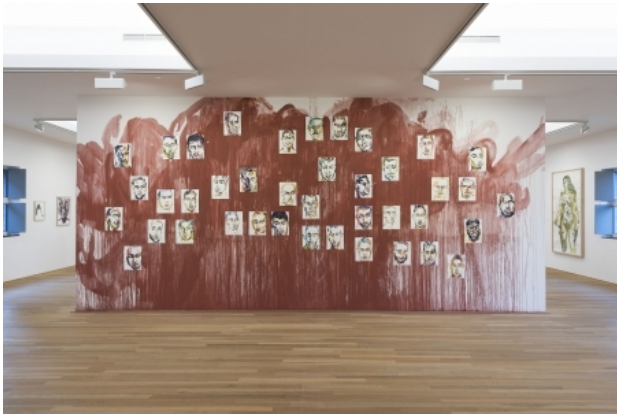
Quarantaine, 2014 pigment/aquarel/papier