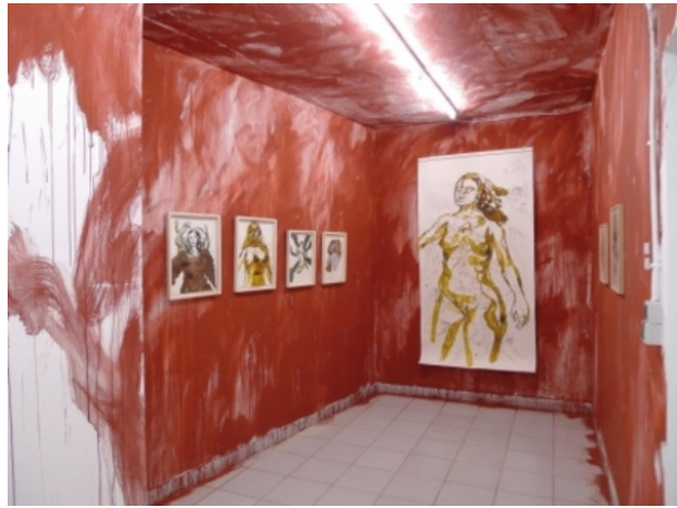
, 2010 pigment / aquarellen