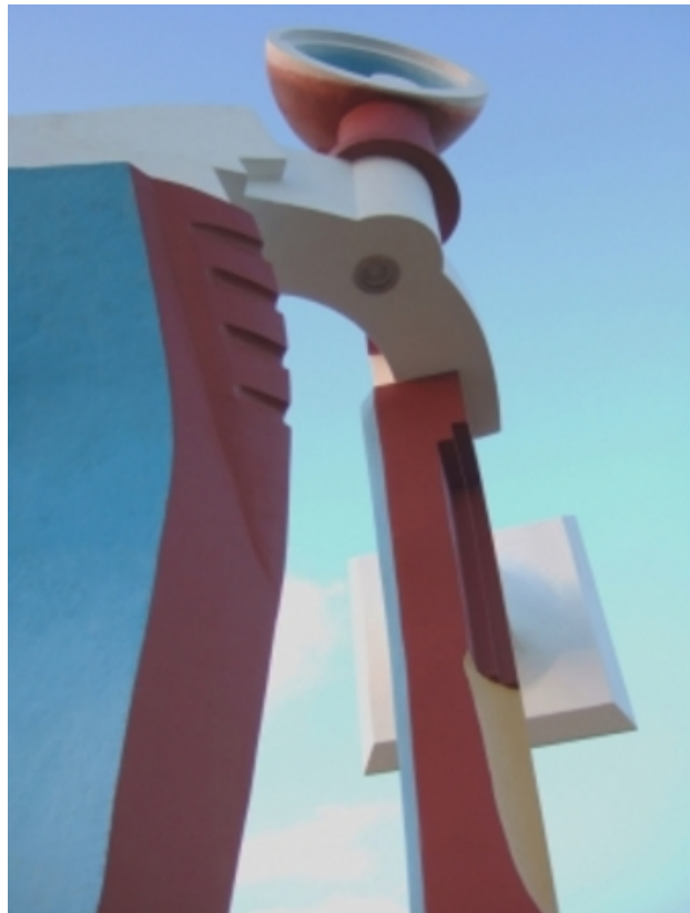
'De Verwijzing', 2008 kleurbeton, hoogte ± 7 mtr