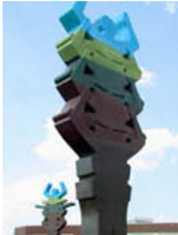
G/H/L, 2004 kleurbeton met relief, 6000 (diameter) x 650 x 150 x 40 cm