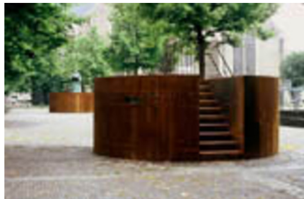
Dialog met Erasmus, 1995 brons/ijzer, Twee cilinders van 500(d) x 200(h) cm