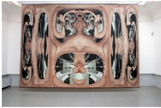
'La maison de Msr Piranesi', 2010 digitale tapisserie, 600 x 435cm