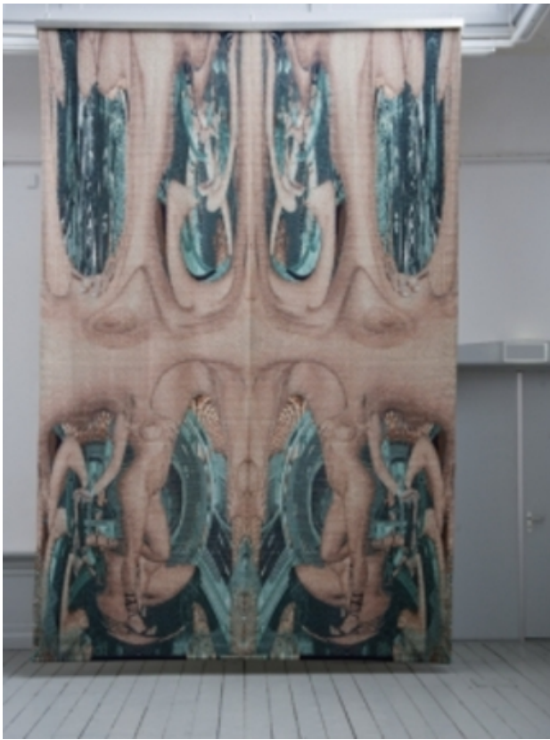
'La maison de Mme Piranesi', 2010 digitale tapisserie, 300 x 465 cm