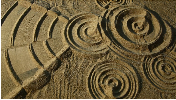
Documentary Steen in water-HD, 2019