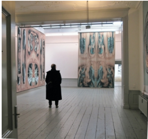
installatie in Pictura, Dordrecht, 2011 digitale tapisserie