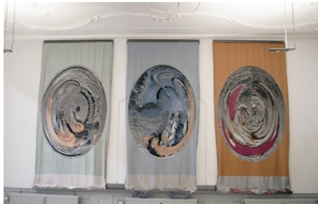
'huiselijke bezigheden', 2010 digitale tapisserie, 550 x340 cm