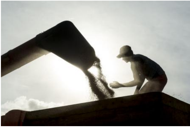
Soy, 2018 fotografie