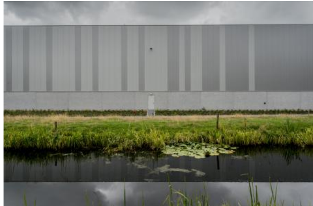
Ergens in Nederland, 2020 fotografie