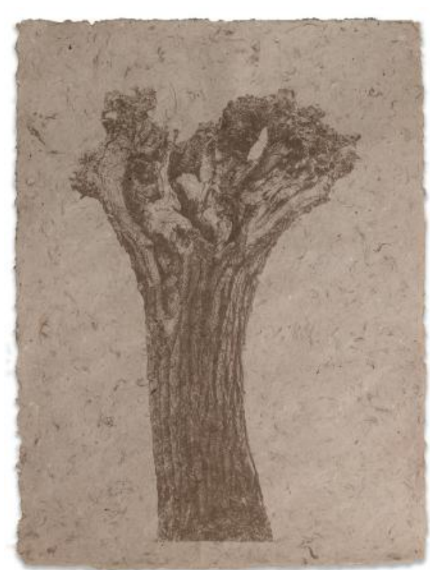
Wilg, 2019 zeefdruk met wilgpigment op wilgpapier, 70 x 100 cm