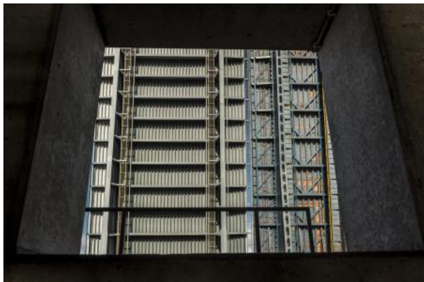
Inside, 2019 fotografie