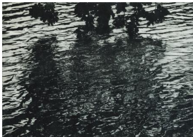
Waterkant, 2020 polymeerets, 38 x 55 cm