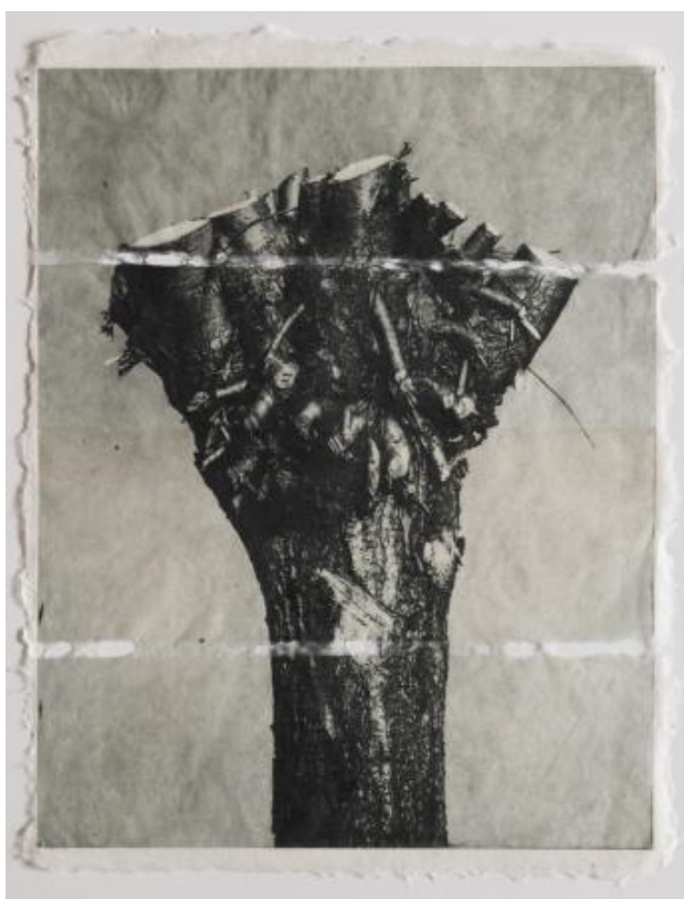
Wilg, 2019 polymeerets op kozopapier, 30 x 38 cm