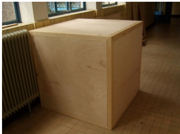
Kubus, 2011 wood and text, 1.50x1.50x1.50 mtr