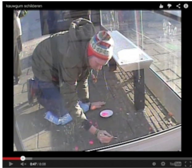
painting chewing gum, 2010 video/performance