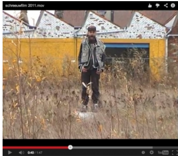
Screamingplaces (Gent), 2012 video and map