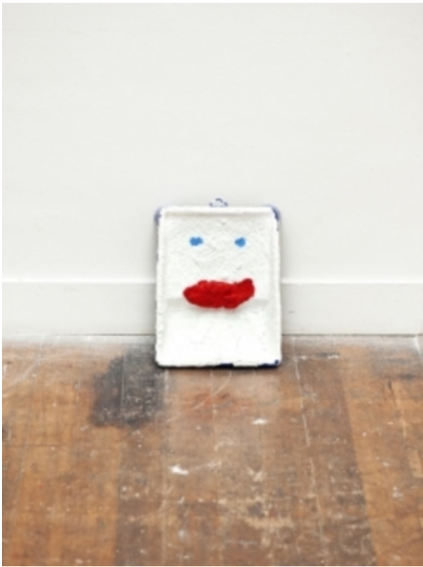
paint tray with clay, 2011 tray, acryl, clay, 20x30 cm