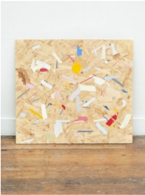
chip wood with colour, 2012 chip wood, acryl, 77x69 cm