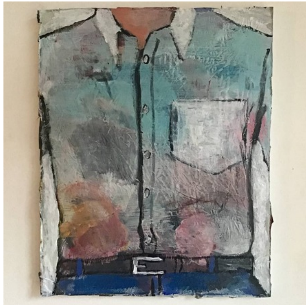
, 2020 Gemengde techniek op doek, 50 x 40 cm