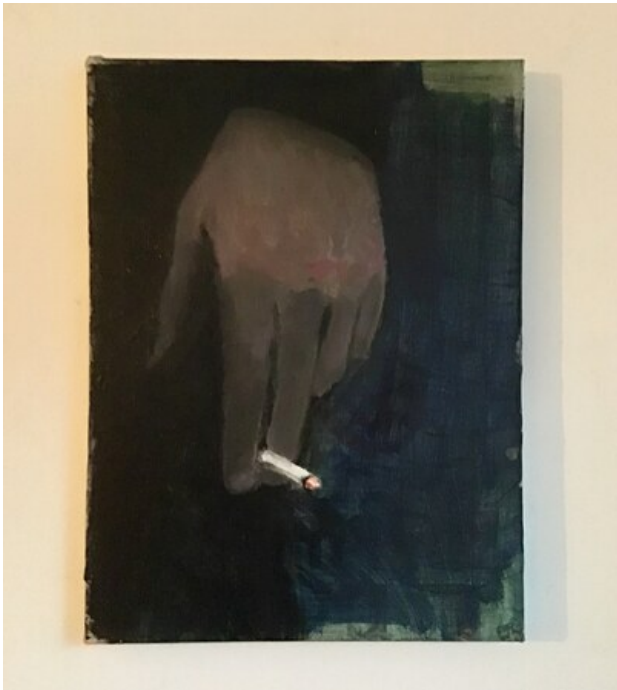
, 2020 Gemengde techniek op doek, 40 x 30 cm