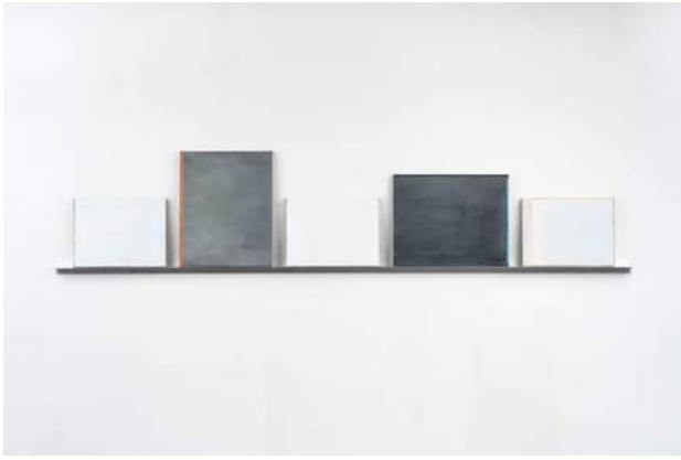
Made in Vietnam, 2019 installatie, olieverf op doek, 50 x 250 x 5 cm