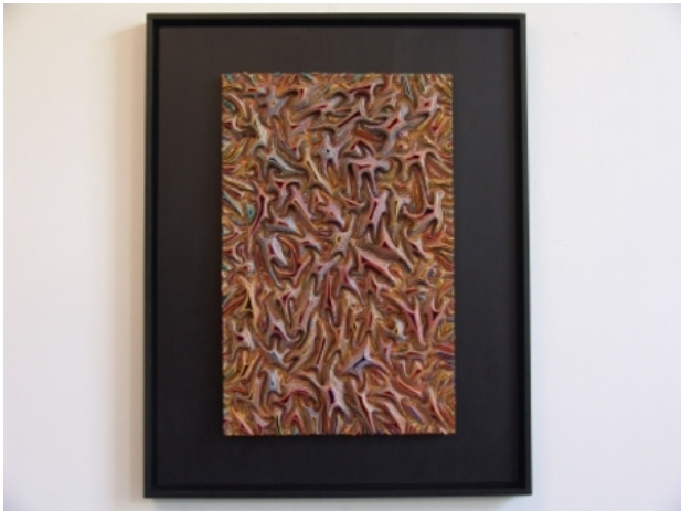
autonom plastic reality016 , 2016 beeldhouwer, 122x60