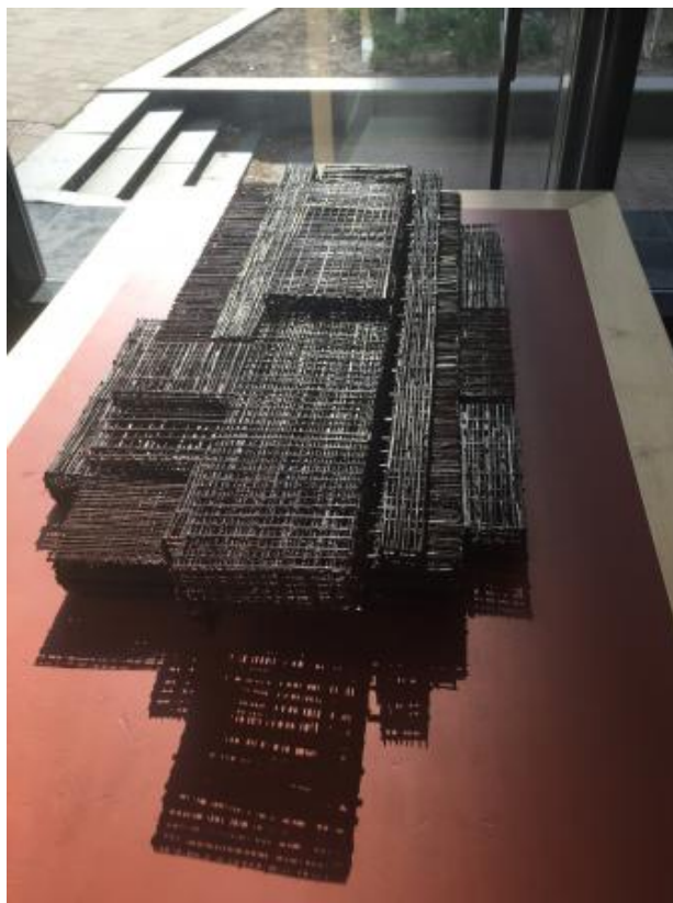
no title, 2021 3d autonoom, 110x35x12