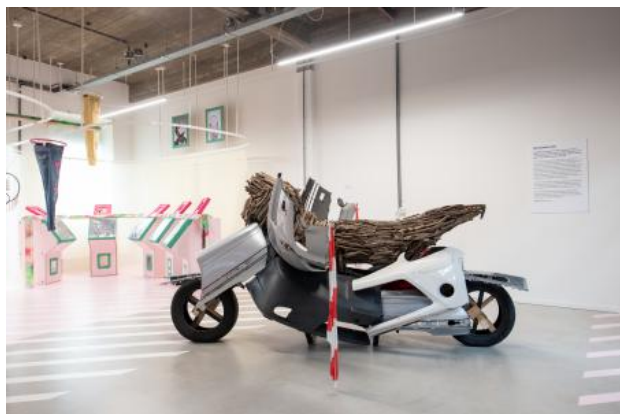
no title, 2021 3d autonoom, 350x100x180

1998 - initiator en penningmeester stichting 2013 CuCoSa