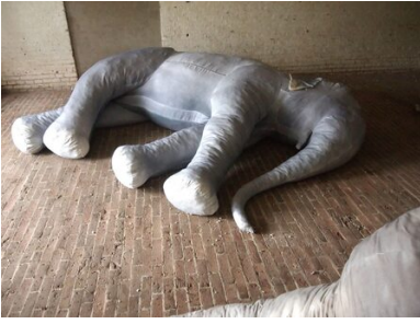
Come to me when thou hast seen the elephants dance, 2018 Katoen, Pigment, Schuim, Drie maal 340x240x60cm