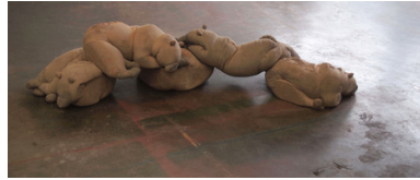
Daer hi vant den meesten stroom, 2016 Beton, Pigment, 160x50x45