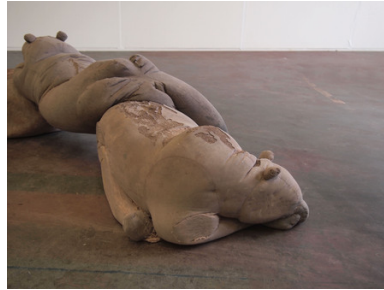
Daer hi vant den meesten stroom (detail), 2016 Beton, Pigment, 160x50x45