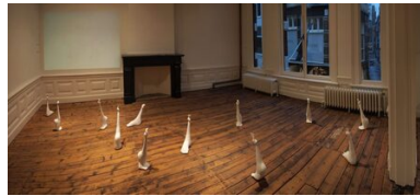
Van de weeromstuit gelukkig zijn, 2015 Katoen, Gips, Twaalf maal circa 30x15x50