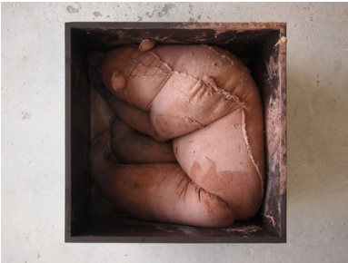
Des Coninx Bode, 2016 Beton, Pigment, Hout, Lak, 45x45x35