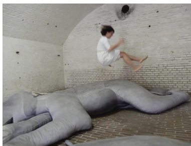
Come to me when thou hast seen the elephants dance, 2018 Katoen, Pigment, Schuim, Drie maal 340x240x60cm