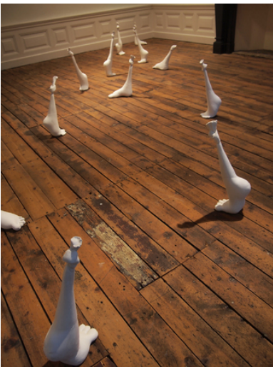
Van de weeromstuit gelukkig zijn, 2015 Katoen, Gips, Twaalf maal circa 30x15x50