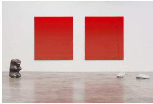
Overview L'Estate, 2023