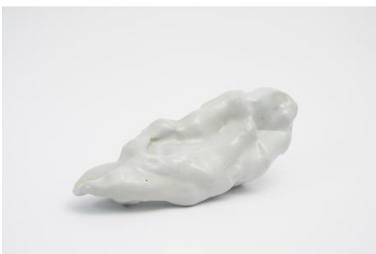
Chew, 2023 glaze on porcelain, 57 x 22 x 19 cm