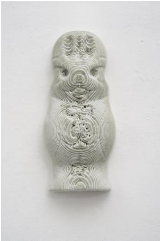
Rabbit in Stratum, 2023 celadon on 3D printed porcelain, 35 x 17 x 8