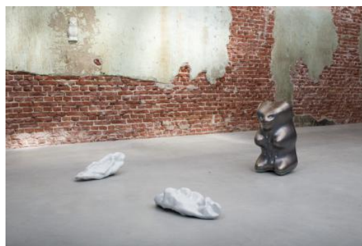
Overview Sundaymorning@EKWC, 2023