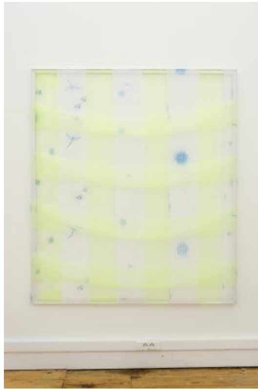
Aerosol, 2021 polyester curtains, 160 x 140