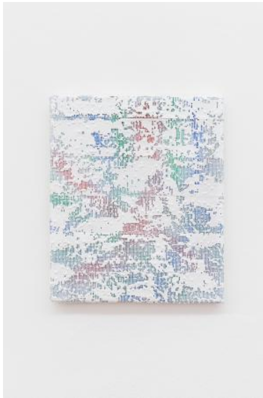
Pixel Dream Work, 2022 acrylics on glass fibre tape and jeans, 50 x 40 cm