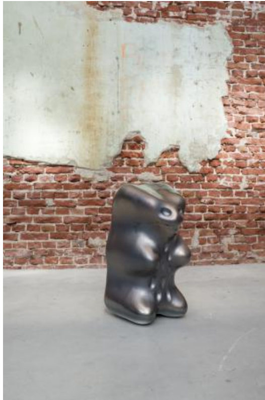
Globule, 2023 coppersaturation on earthenware, 70 x 35 x 35 cm