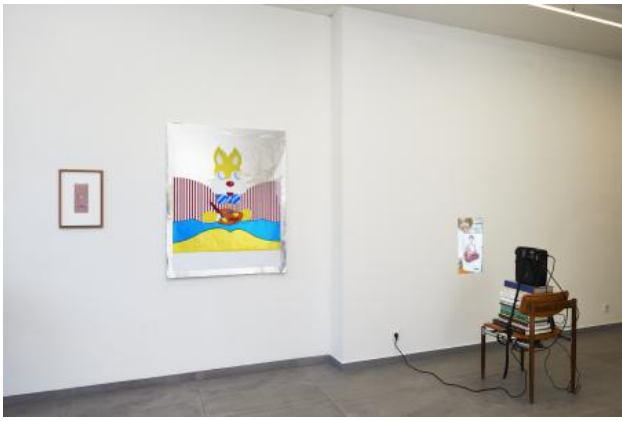
After Daan van Golden, 2021