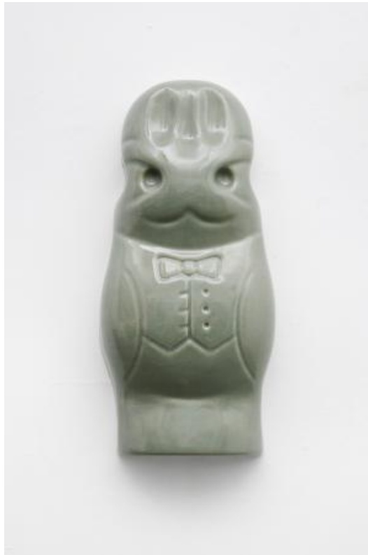
Blue Moon (iv), 2022 Jun glaze on stoneware, 70 x 30 x 15