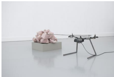
It's ok not to be complete , 2017