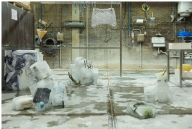
Beeldenstorm x Grafisch Atelier Daglicht, 2018 Timebased installation