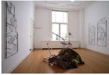
Heading into the forest, never to walk back again , 2022