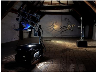
It comes in teams of two, 2022 Forged metal, -