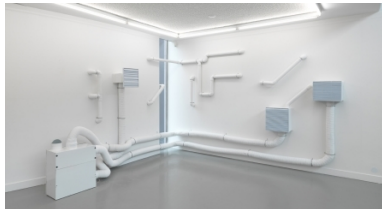
Trial and error, back and forth, 2017 Installation