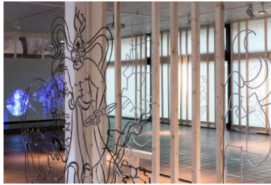
Upaya , 2020