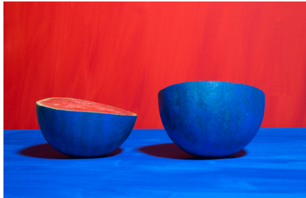
Blue Watermelon, 2017 Fine Art Print, 90x0x64