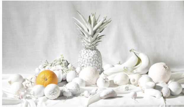
White Composition, 2017 Fine Art Print, 144x0x94