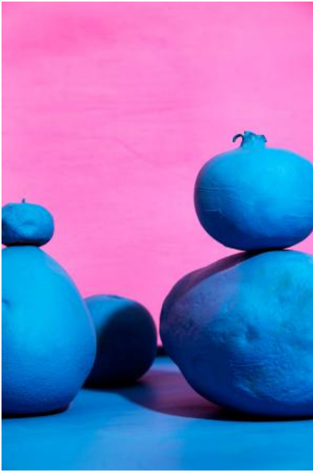
Blue Fruity Landscape, 2022 Fine Art Print Framed, 63 x 88 cm