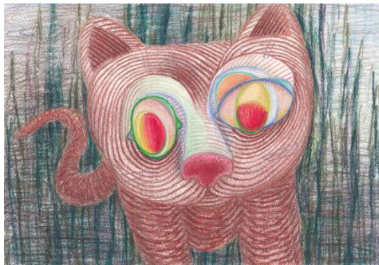
The confusion, 2023 Colored pencil on cotton paper, 29,7 x 20,6 cm