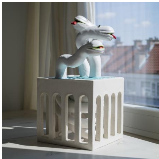
Temple statue of White Snakes, 2024 Ceramics, 14,5 cm x 14,5 cm x 28,5 cm