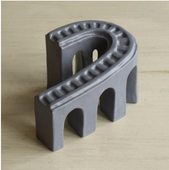
Time-frames - Railway bridge, 2023 Keramiek, 12 x 9 x 9 cm