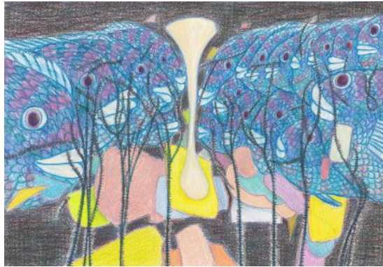
A watched soul, 2023 Colored pencil on cotton paper, 29,7 x 20,6 cm