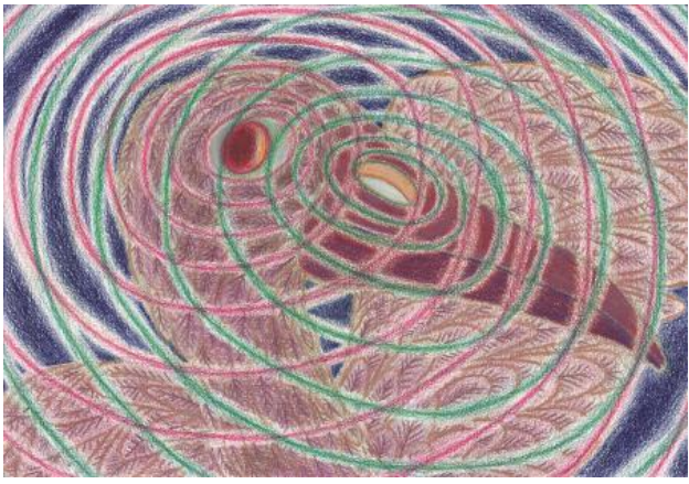
The bird's senses, 2023 Colored pencil on cotton paper, 29,7 x 20,6 cm