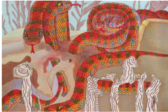
The happiness of the snakes., 2022 Water gedragen olieverf op linnen doek., 120 x 80 cm