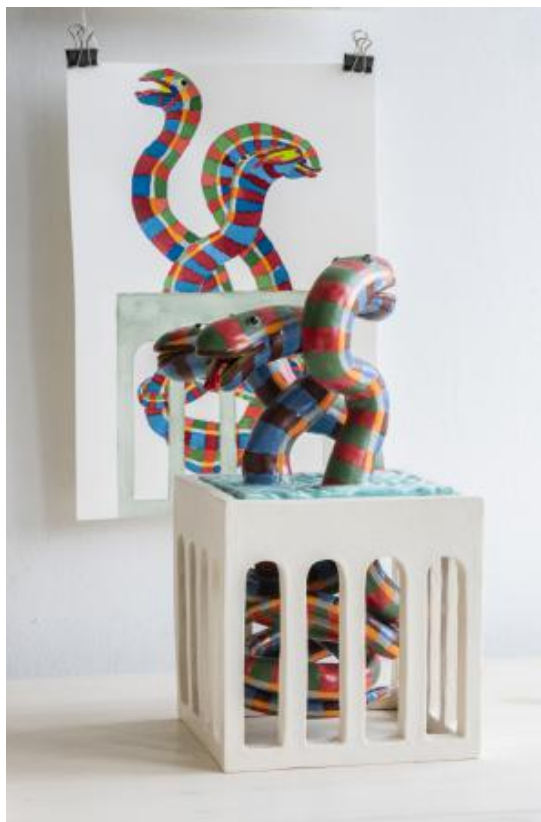
Temple statue of Forest Snakes, 2024 Ceramics, 14,5 cm x 14,5 cm x 28,5 cm