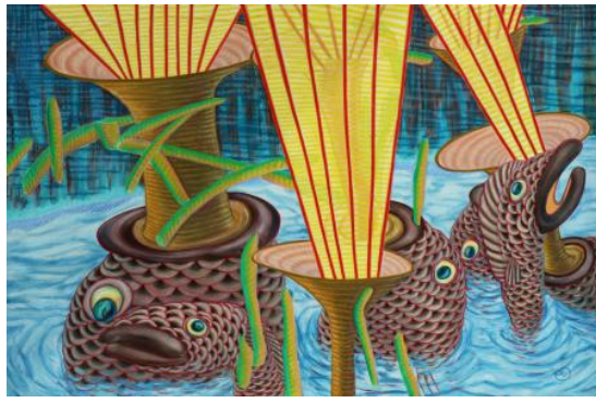
Attention!, 2022 Water gedragen olieverf op linnen doek., 120 x 80 cm