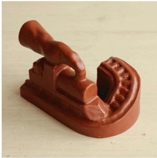
Time-frames - Train track, 2023 Keramiek, 14 x 9,5 x 8 cm