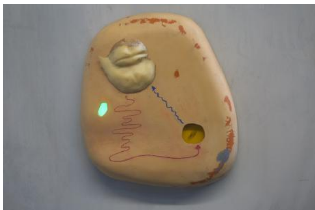
The Box (detail), 2022 mixed media, 420cm x 300cm x 250cm