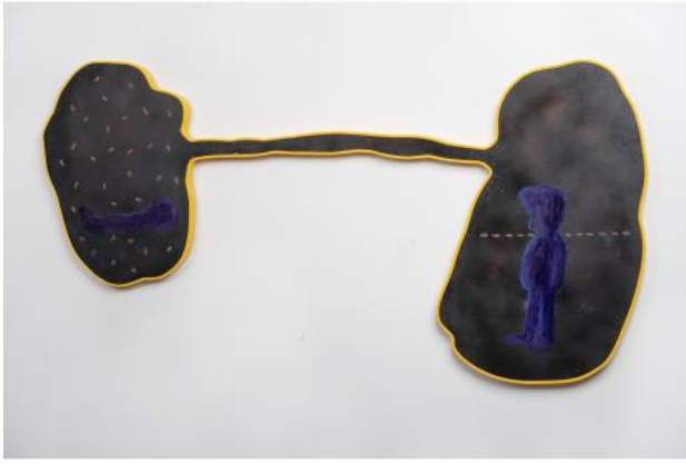
Texas Switch: Bellow, 2021 olieverf, spuitverf, printer-inkt, plexiglas en kunststof profiel, 130cm x 65cm x 3cm