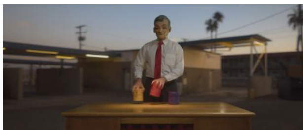
Fragment of 5000 Miles: The Conjuror, 2021 videostill, 1min20s