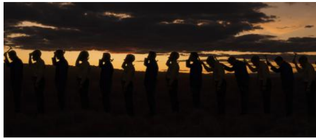
Fragment of 5000 Miles: Folie à plusieurs, 2021 videostill, 4min56s loop