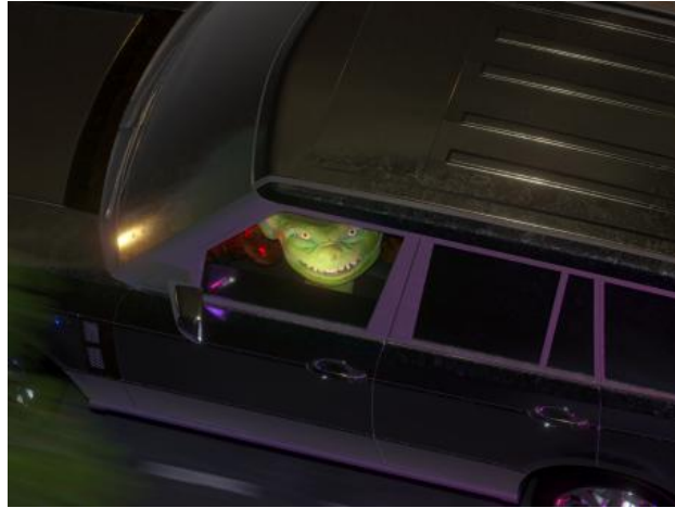
Goblin attitude, 2020 videostill, 41 sec videoloop