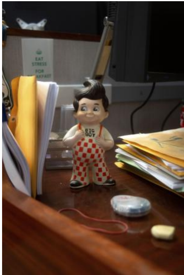
Black Rock, Soft Storm (detail), 2023 multichannel video installation, 600cm x 350cm x 300cm