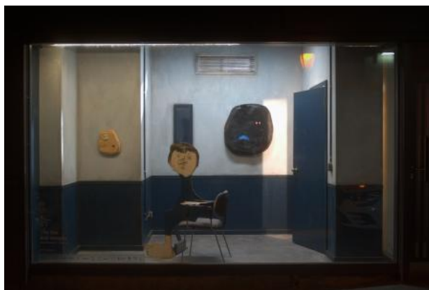
The Box (overview), 2022 mixed media, 420cm x 300cm x 250cm