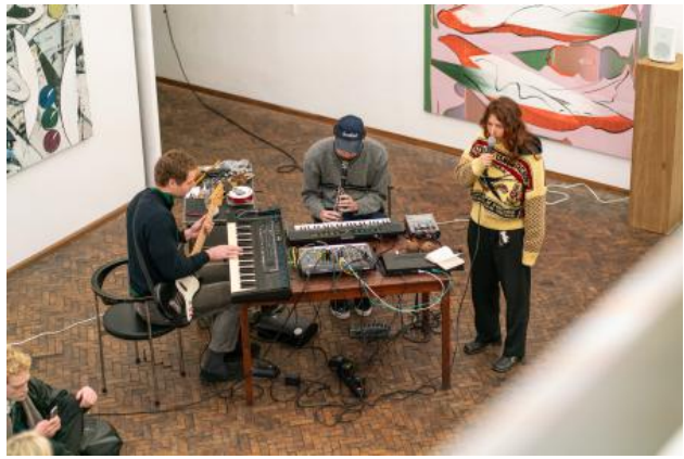
Performance Een tor met Elan, 2019