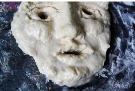
Lady Artist Club, 2019