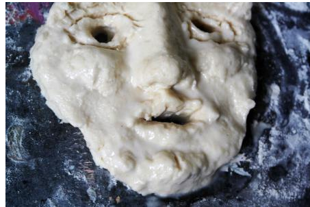
Lady Artist Club, 2019