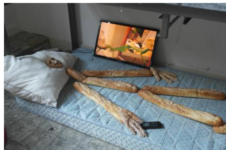
Lady Artist Club, 2019