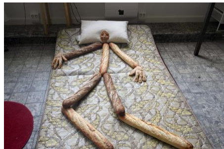
Lady Artist Club, 2019