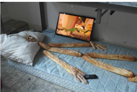
Lady Artist Club, 2019