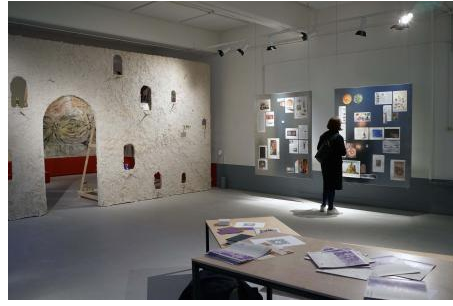
Bericht van de duif, 2024