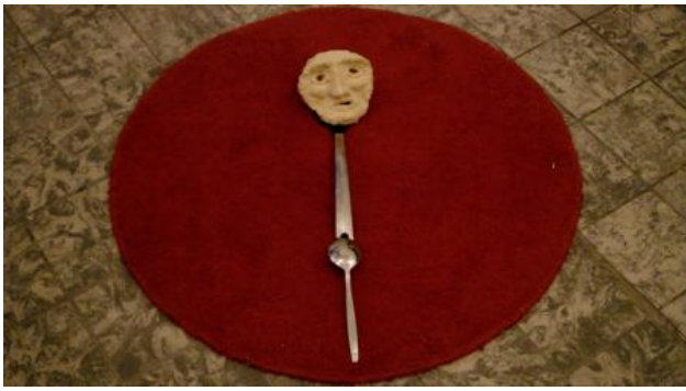
Lady Artist Club, 2019