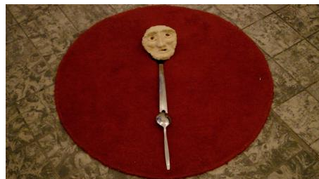
Lady Artist Club, 2019