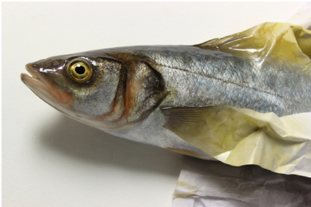
Sea bass paper, 2017