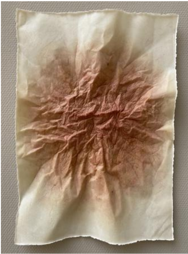
Kaart, 2019 siliconen, katoenvezel, mensenhaar, 58x41x5 cm