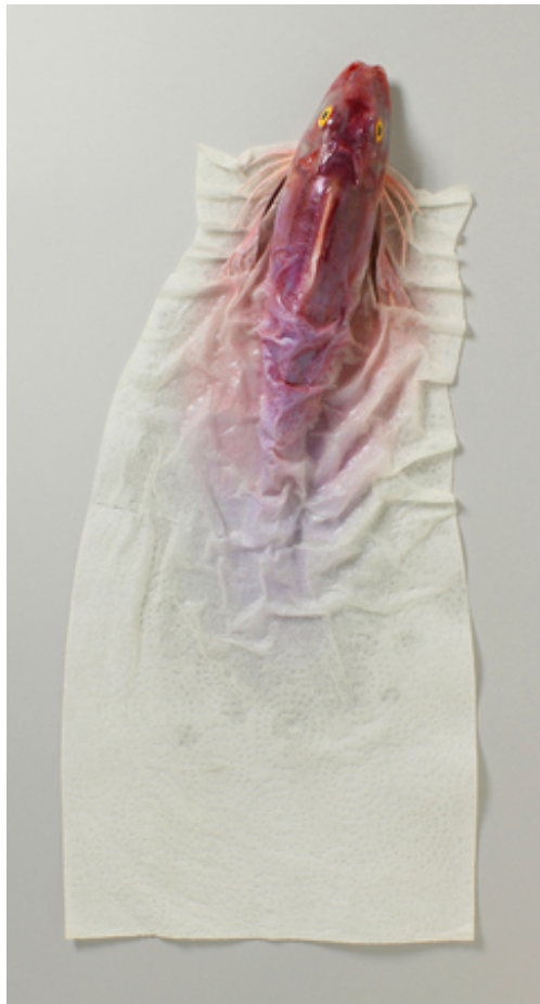
Paper towel gurnard, 2017 polyester, polyurethane, acrylics, paper, 48x23x7 cm