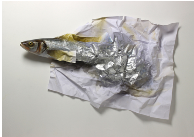
Sea bass paper, 2017 polyester, polyurethane, acrylics, paper, 63x39x6 cm