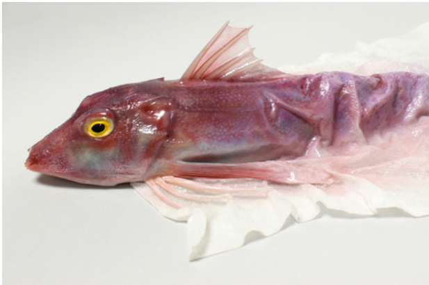
Paper towel gurnard, 2017