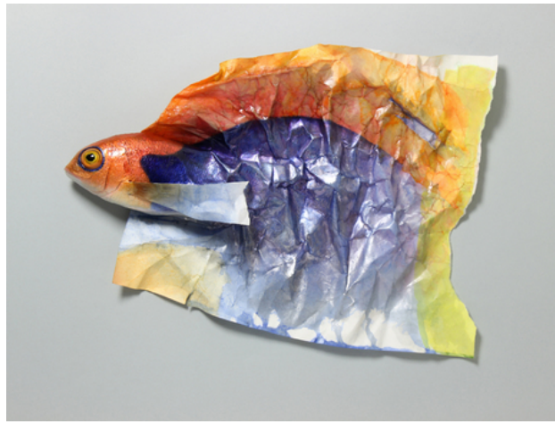
Bicolored paper finfish, 2018 polyester, polyurethane, acrylics, paper, 23x33x4 cm