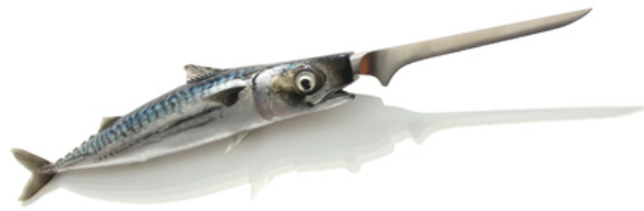
Knife mackerel, 2015 polyester, polyurethane, acrylics, knife, 9x59x6 cm