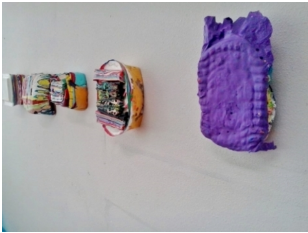
Studio wall, 2018 acrylic and medium on canvas