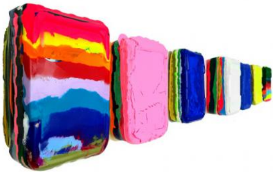
Untitled_series 2021, 2021 Acrylic and plaster / medium on canvas, 17,5 x 12 x 6 cm