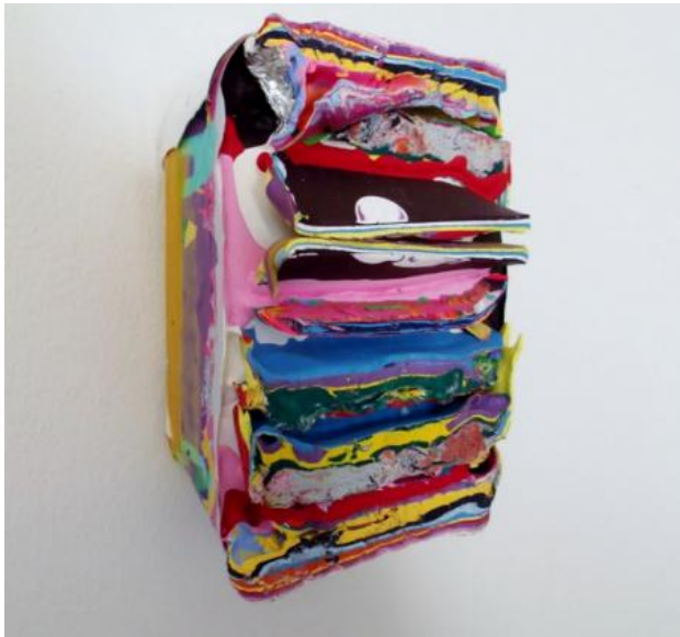
Layers2, 2017 Acrylic and medium on canvas