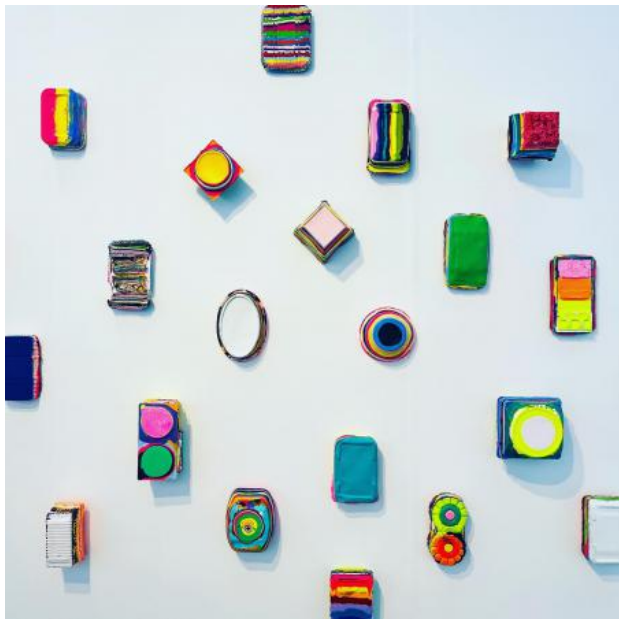
Untitled, 2023 Acrylic, plaster and medium on canvas, Serie small sizes