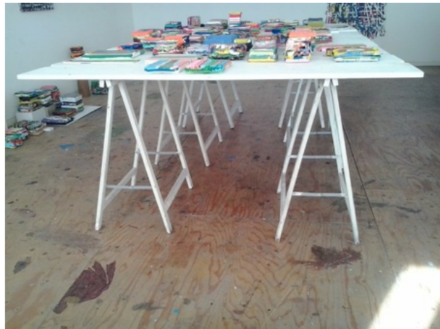
Tableworks, 2018 acrylic and medium on canvas