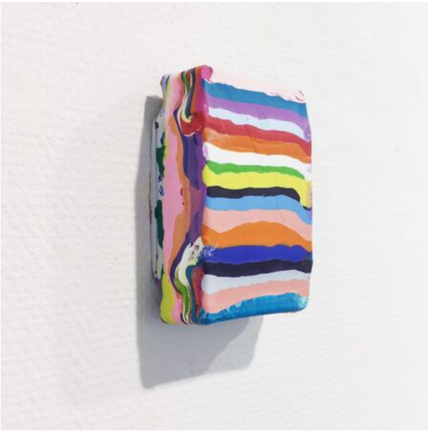
All_lines, 2017 acrylic and medium on canvas