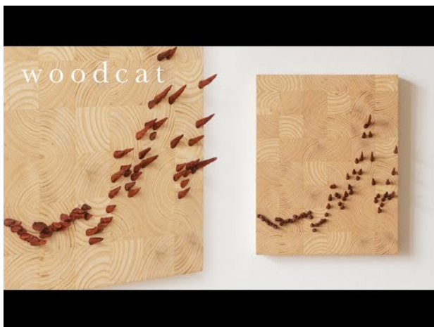
Turning Data into Art - LUMBER PRICES ON FIRE, 2022

2022 - -- Daarnaast gebruik ik mijn kennis en kunde van de houtbewerking voor het maken van lijsten in opdracht voor andere kunstenaars. On-going