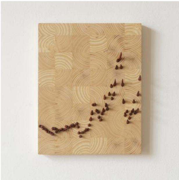
Lumber prices on fire, 2022 houtbewerking/beeldhouwen, 27x29x2,8