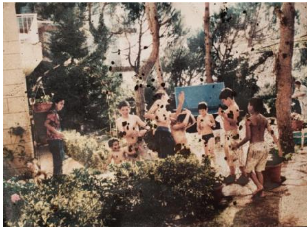
Through ribbons and flowers, 2015