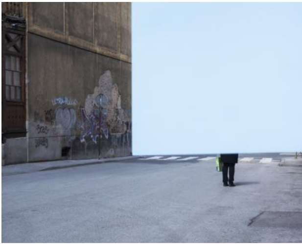
I saw a man pursuing the horizon, 2016