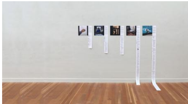
Notes on top surgery