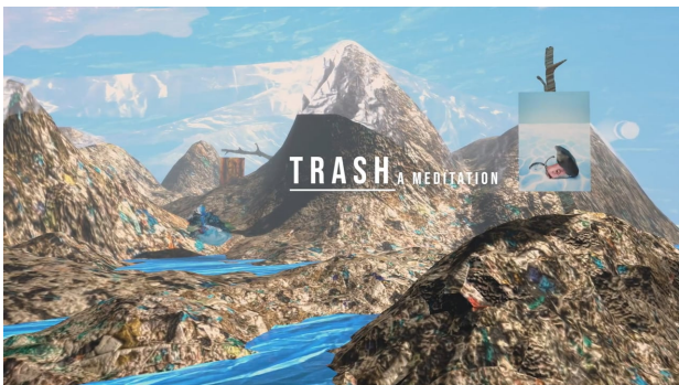
Trash, a meditation, 2020 3:40