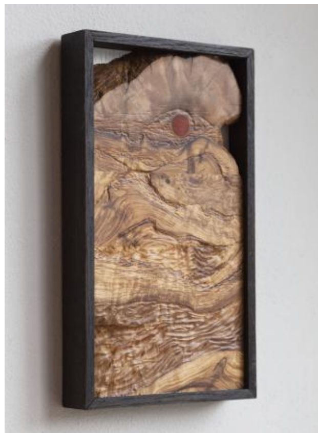
Jupiter, 2022 Beeldhouwen, 13x3x22