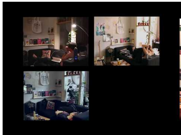
Stim time, 2017