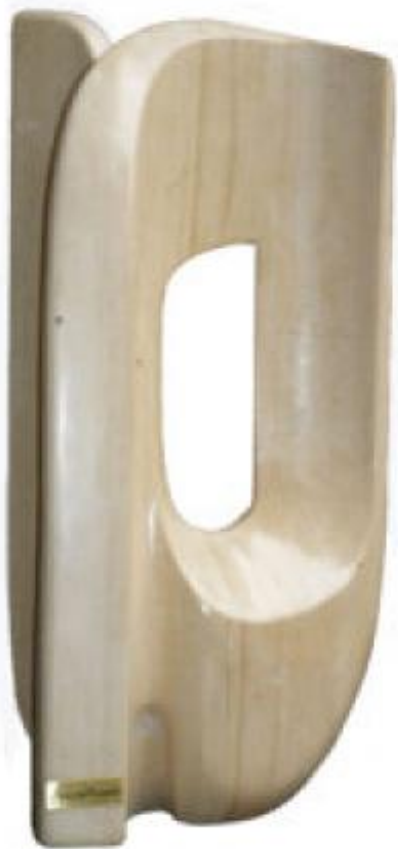
zonder adres, 2014 marmer, 80 x 40 x 30 cm