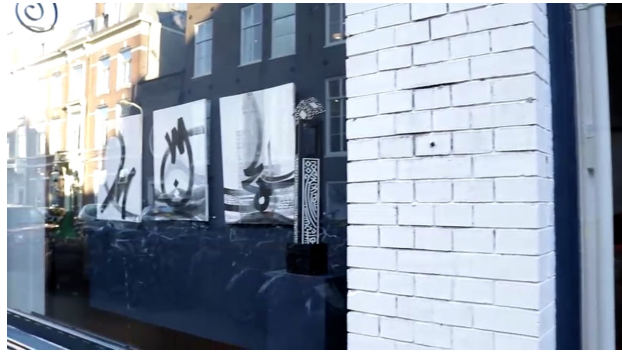
De belangrijkste tentoonstellingsgevel in de galerij DE TWEE PAUWEN, 2024 13:00 seconde