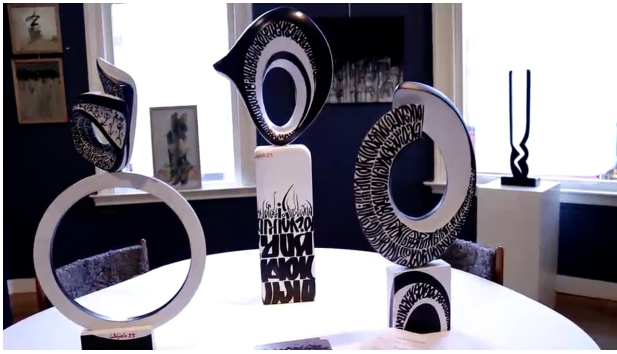
Mijn galerij op DE TWEE PAUWEN , 2024 1:02 minuut