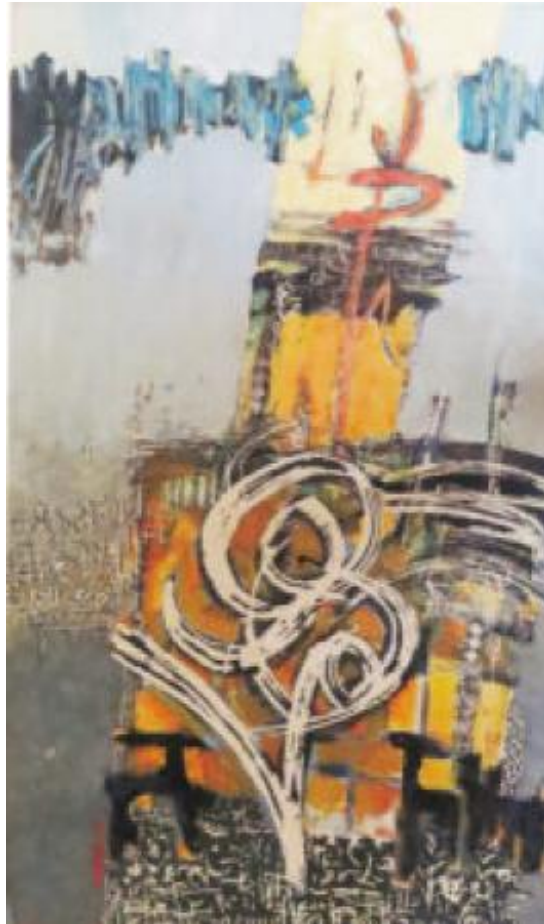
Landengte, 2023 Acryl op canson , 70 x 52 cm