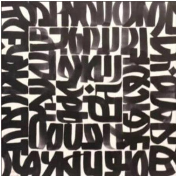
levende schaduwen 1, 2023 Acryl op doek, 40 x 40 cm