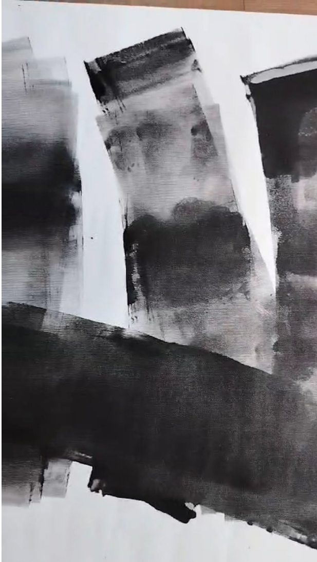
Schaduwen van letters, 2022 1:44 minuten