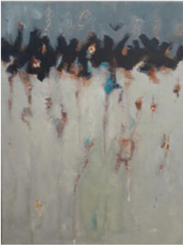
Horizon voor zwart, 2023 Acryl op doek , 43 x 33 cm