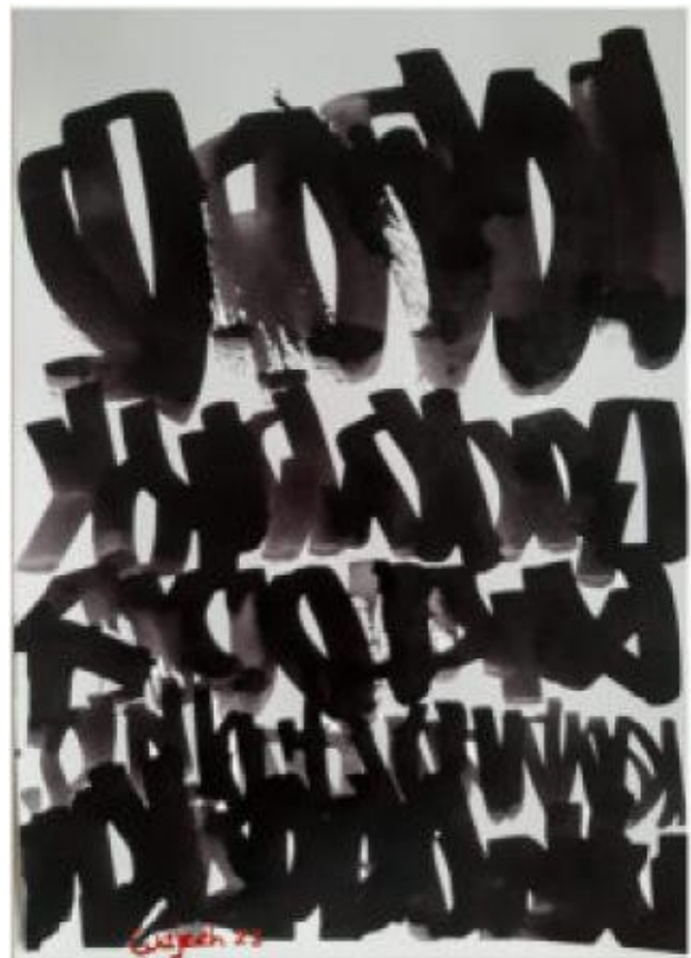
levende schaduwen ....10 , 2023 Acryl op canson , 30 x 40 cm 3