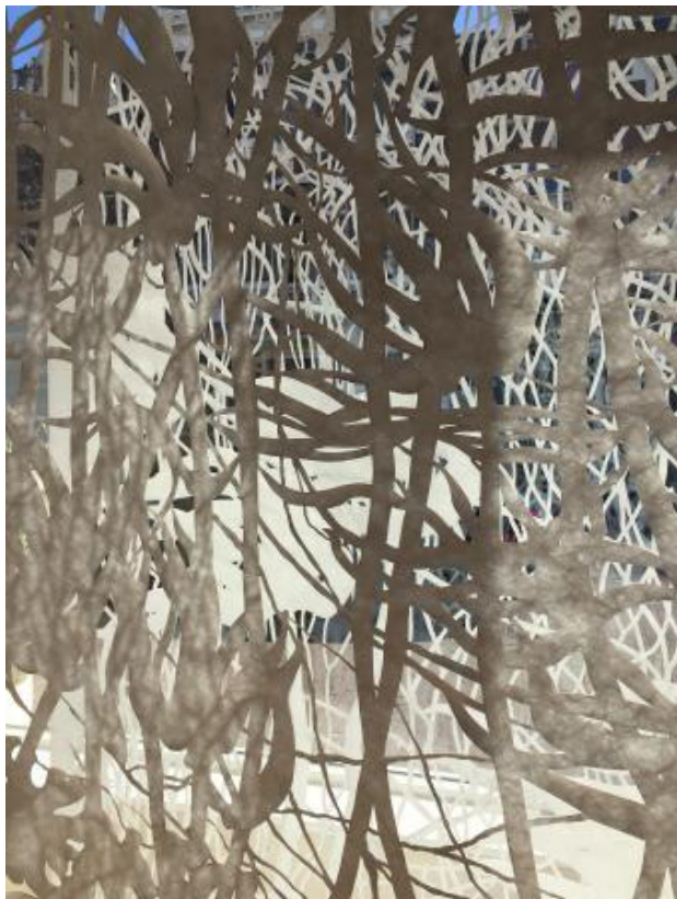
Zeewierwoud = Kelpforest, 2020 Handcut Tyvek, 60x143x334