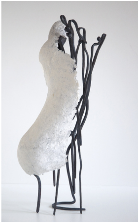
Wit voetje, 2015 forged CorTen and paper, 25x15x15 cm