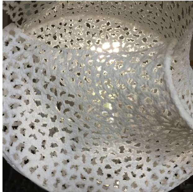
Lichtnet, 2016 papier maché