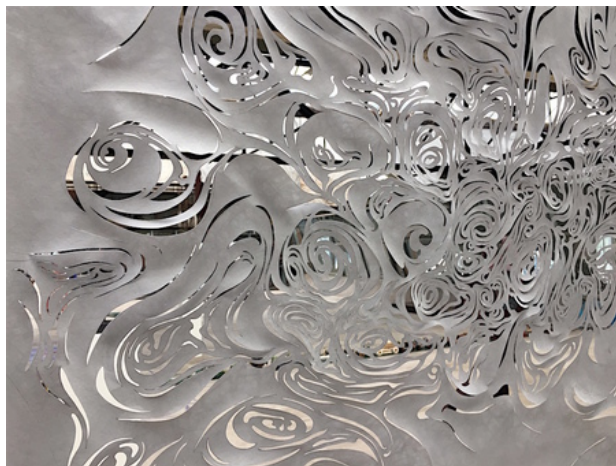
Schouwerzijl, détail, 2017 handcut Tyvek, 153x90 cm