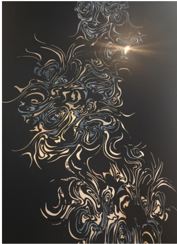
Berlin -detail, 2016