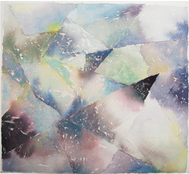
Galaxy, 2019 watercolor, 30x40