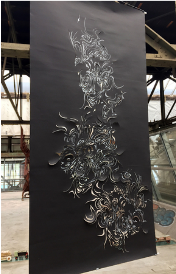
Berlin, 2016 pencil and handcut paper, 100x210 cm