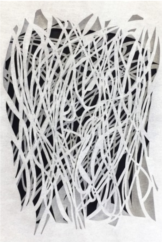
Schouwerzijl, détail, 2017 handcut Tyvek, 153x90 cm